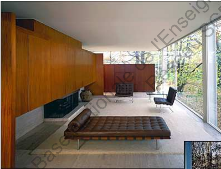
Farnsworth house 1946/1951 Ludwig Mies Van der Rohe Document 2