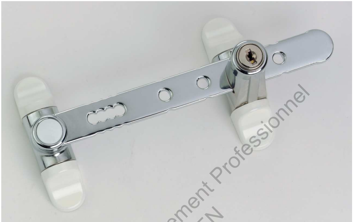
Entrebâilleur de sécurité pour fenêtre « Airlock »

Version à clé : sécurité maximale contre les risques de défenestration et de vol (antivol). Version idéale pour la prévention dans les collectivités (écoles, hôpitaux, maisons de retraite). Existe également en version à bouton poussoir.