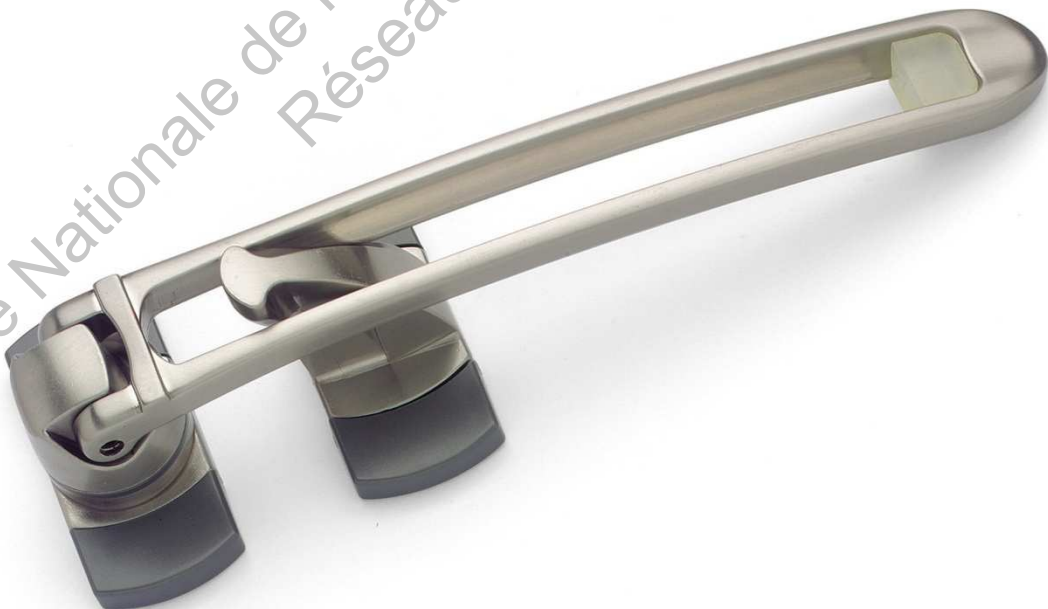
Entrebâilleur de sécurité pour porte « Most »

Le seul entrebâilleur rabattable verticalement contre l'huissierie en position repos : esthétique, faible encombrement, évite la fermeture inopportune de la porte (courant d'air, enfant, animal domestique).