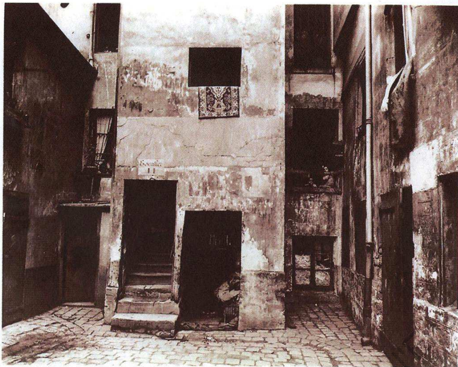
Fig. 1. / Eugène ATGET, Rue Broca , 1912, extrait de la série Topographie , Paris 1906–1915.