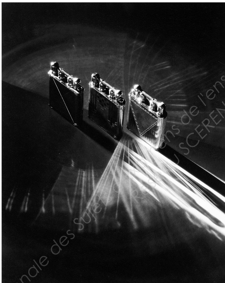
Edward Steichen, Briquets Douglass Lighters (réalisé pour l'agence J. Walter Thompson), 1928