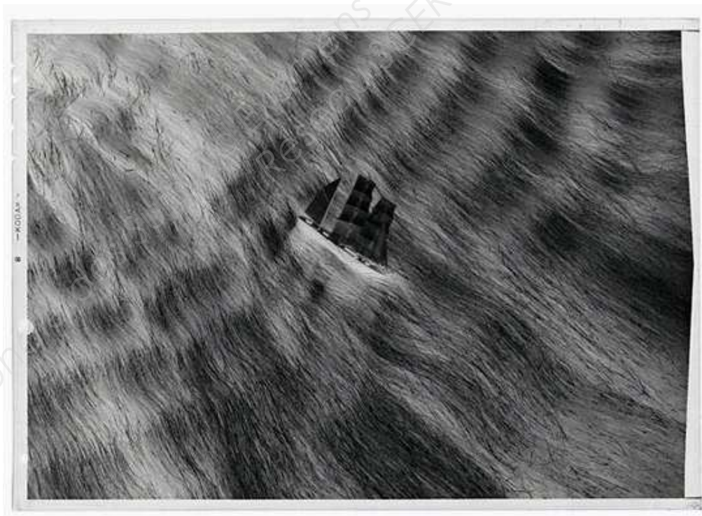
Dora Maar, Etude pour une publicité pour le shampoing Pétrole Hahn, 1934