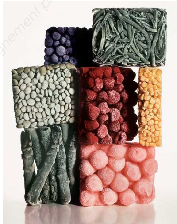
Irving Penn, Aliments congelés , New York, 1977