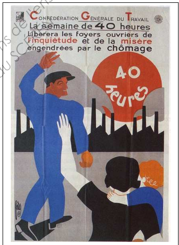
Affiche de Peiros, Biblio.nationale de France, Paris.