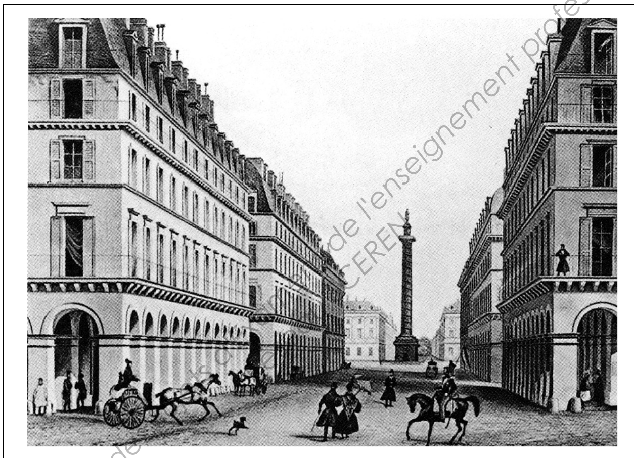
Gravure montrant un percement supplémentaire vers la colonne Vendôme.

PERCIER et FONTAINE , projet de percement de la rue impériale, Paris , gravure, 1801.