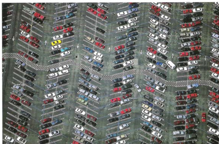
Gainesville, Floride, Parking de l'université de Floride et zone piétonne

Alex S. MACLEAN , photographies extraites du livre " OVER, Le paysage aérien américain ", 2008, Série Les parkings.