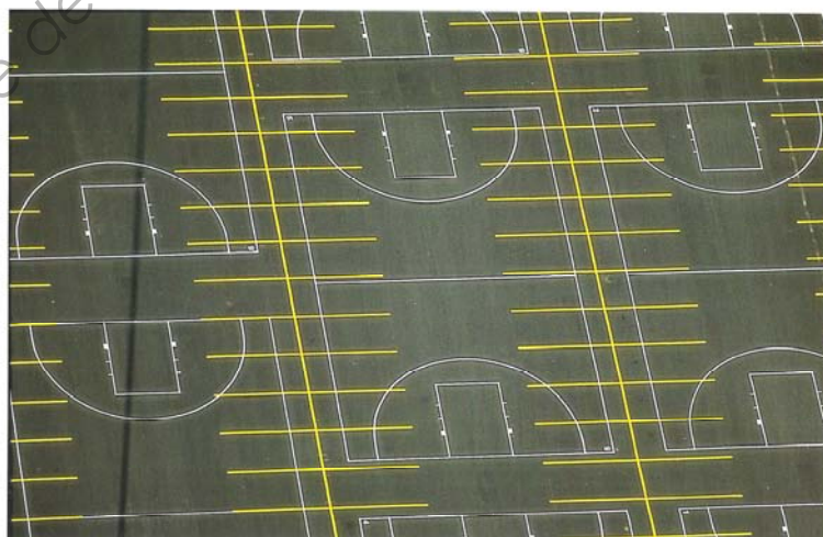
Waltham, Massachusetts, Superposition de grilles de stationnement et de terrains de sport