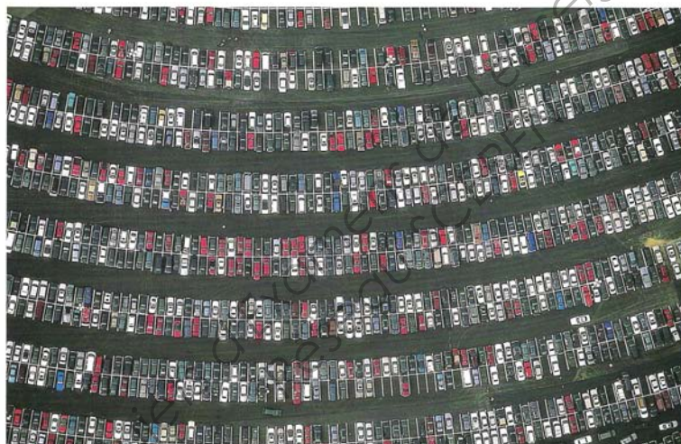
Gainesville, Floride, Parking de l'université de Floride