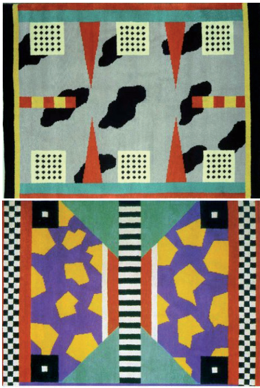
Tapis, Nathalie du Pasquier, 1984.