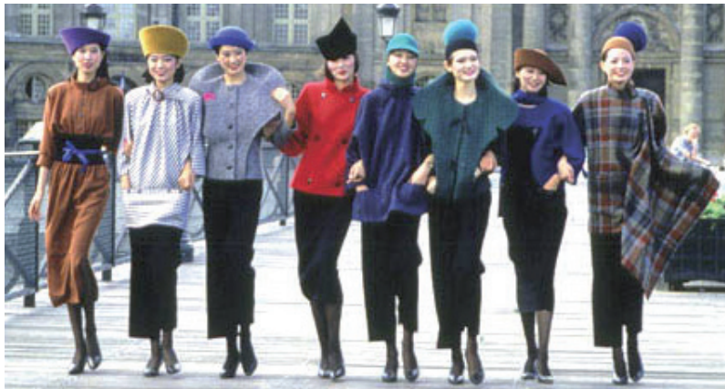
Ensembles Pierre Cardin, 1985.

Baccalauréat Professionnel : Marchandisage Visuel