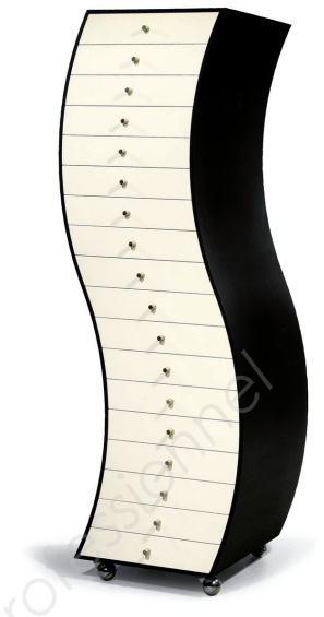
Capellini Progetti Compiuti, Shiro Kuramata, 1970.