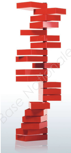
Revolving Cabinet, Shiro Kuramata, 1970.