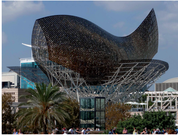
Barcelona Fish, Frank Gehry, 1992.