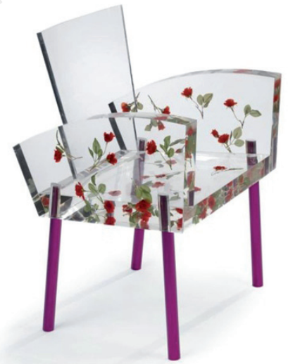
Fauteuil Miss Blanche, résine acrylique, aluminium anodisé, roses artificielles, Shiro Kuramata, 1988.