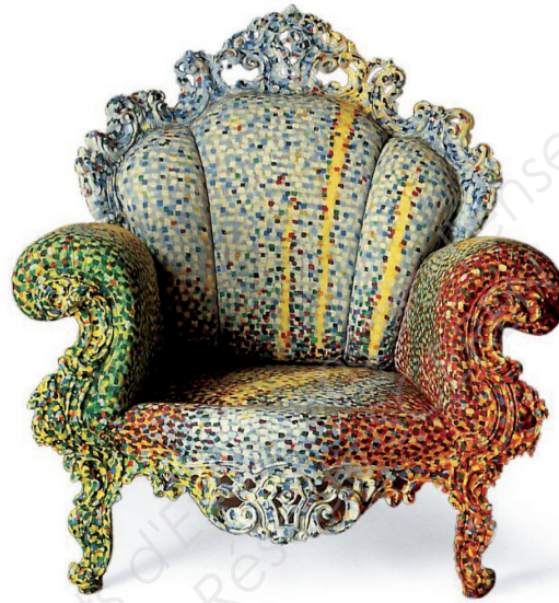
Fauteuil Poltrona di Proust, bois et tissu peints à l'acrylique, mousse de polyuréthane, Alessandro Mendini, 1979.