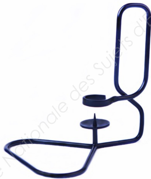
Bougeoir en métal : Lup de Shane Schneck.