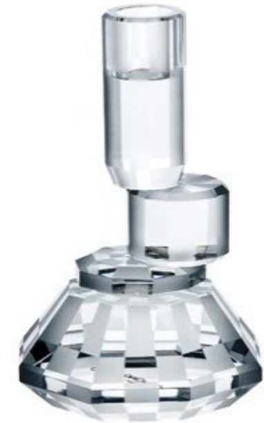
Chandelier Valencia par Jaime Hayon. Cristal.