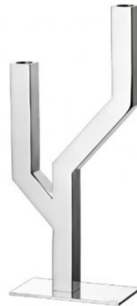
Candélabre en argent Ho pour Christofle .Designer : Ora Ito.