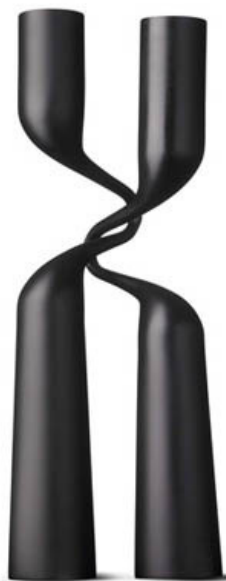
Bougeoir double en acier par Mikaela Dorfer.