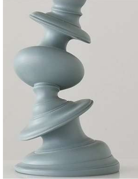
Chandelier distorsion par Paul Loebach. Résine. Hauteur : 25 cm.