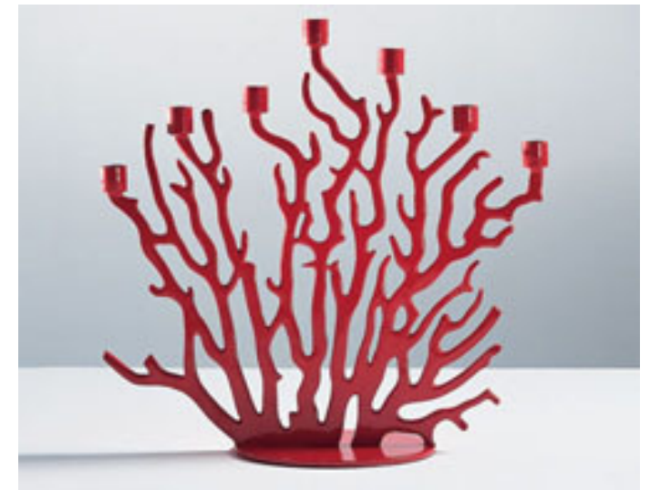
Technochtitlan par Vittorio Locatelli. Aluminium moulé.