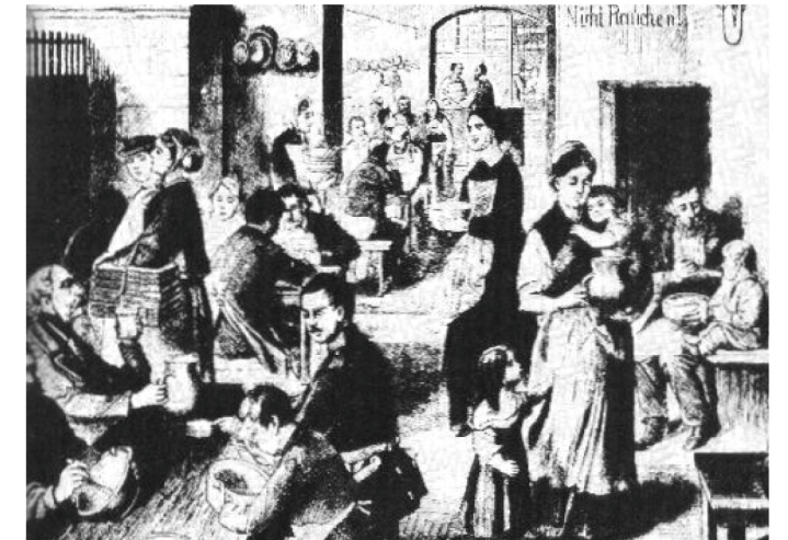
La soupe populaire (gravure allemande, 1875)