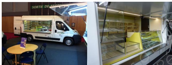
N° 315 600 - FOURGON TOURNEES 3M10 BOULANGERIE PÂTISSERIE

Marque : CITROËN Motorisation : Diesel Garantie : Oui