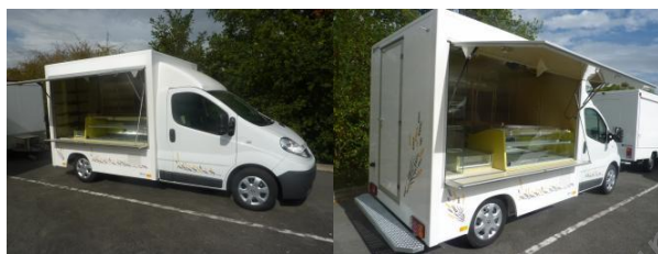
N° 315 581 - CELLULE TOURNEE 2M66 - BOULANGERIE PÂTISSERIE

Marque : RENAULT Motorisation : Turbo-diesel Garantie : Oui Longueur utile : 2.66 m Stock : Oui