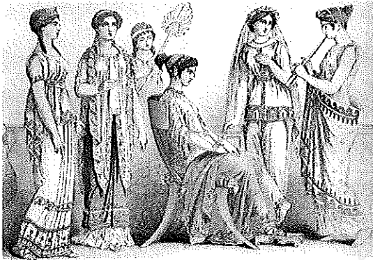
La chiton de la Grèce antique

⇒ Dans les cases ci-dessous reporter le nom des vêtements correspondant aux images.