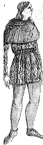
La chainse au Moyen âge