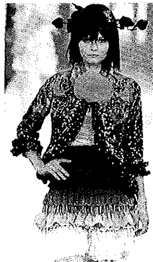
Christian LACROIX été 2007