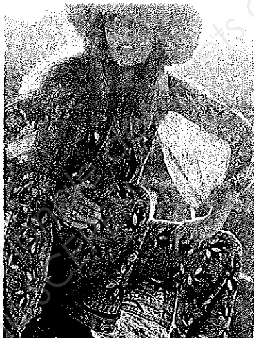
Chemise années 1970