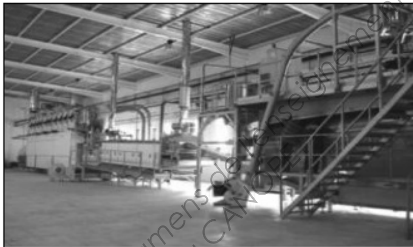
Ligne de production Clextral (exemple)

Plus de 13 000 systèmes CLEXTRAL sont actuellement installés dans 87 pays. CLEXTRAL emploie 227 personnes au sein du groupe Legris Industries qui compte 2 800 employés.