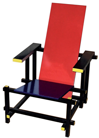
Gerrit Thomas Rietveld «chaise red and blue» / 1917