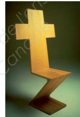
Alessandro Mendini 1978