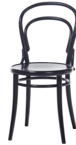
Michael Thonet Caise N°14 «chaise bis- trot» / 1859