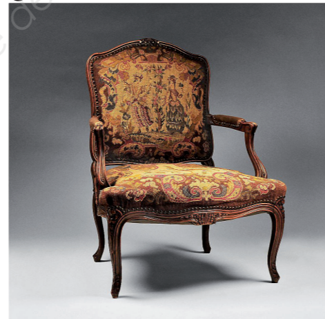
Fauteuil style Louis XV XVIIIe siècle (env. 1730 à 1760)