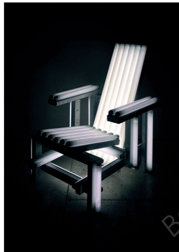
Ivan Navarro «white electric chair» / 2005