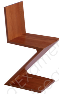
Gerrit Thomas Rietveld «chaise zig-zag» / 1932