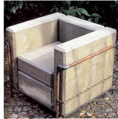
Stefan Zwicky «Domage à Corbu» / 1980