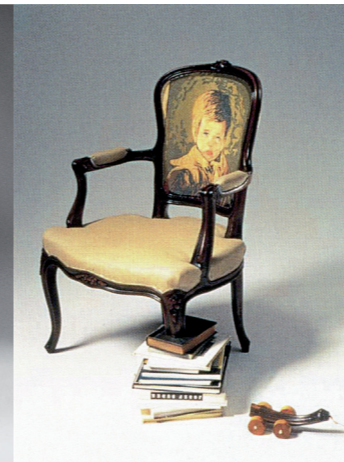
Jurgen Bey Healing chair /2000