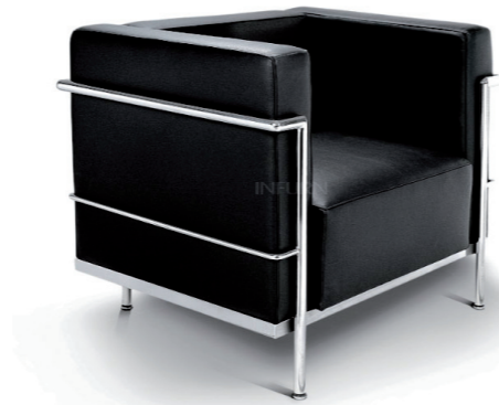
Le Corbusier Fauteuil LC2 /1928