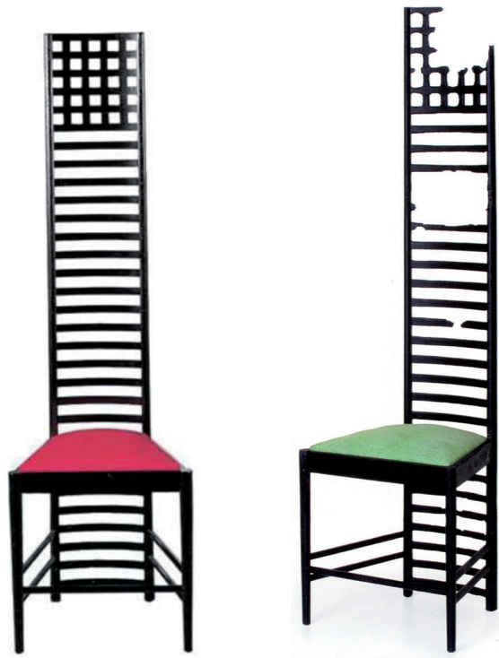
Charles Rennie Mackintosh Chaise Hill House /1902