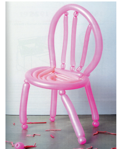
Michel Mallard «pink chair» / 2007