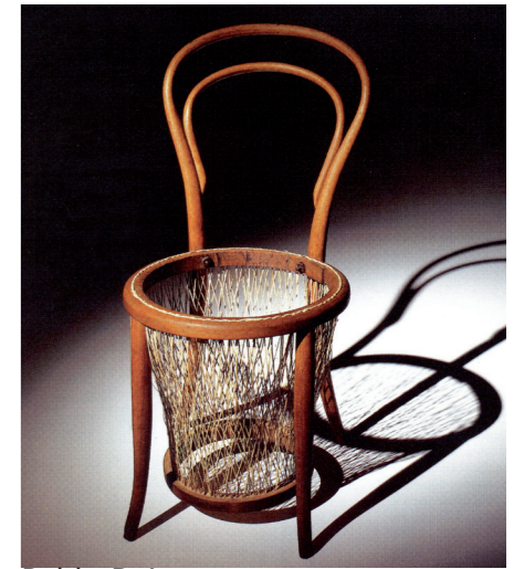
Pablo Reinoso «sculpture» / 2005