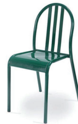
Robert Mallet-Stevens chaise en tubes de métal / 1935