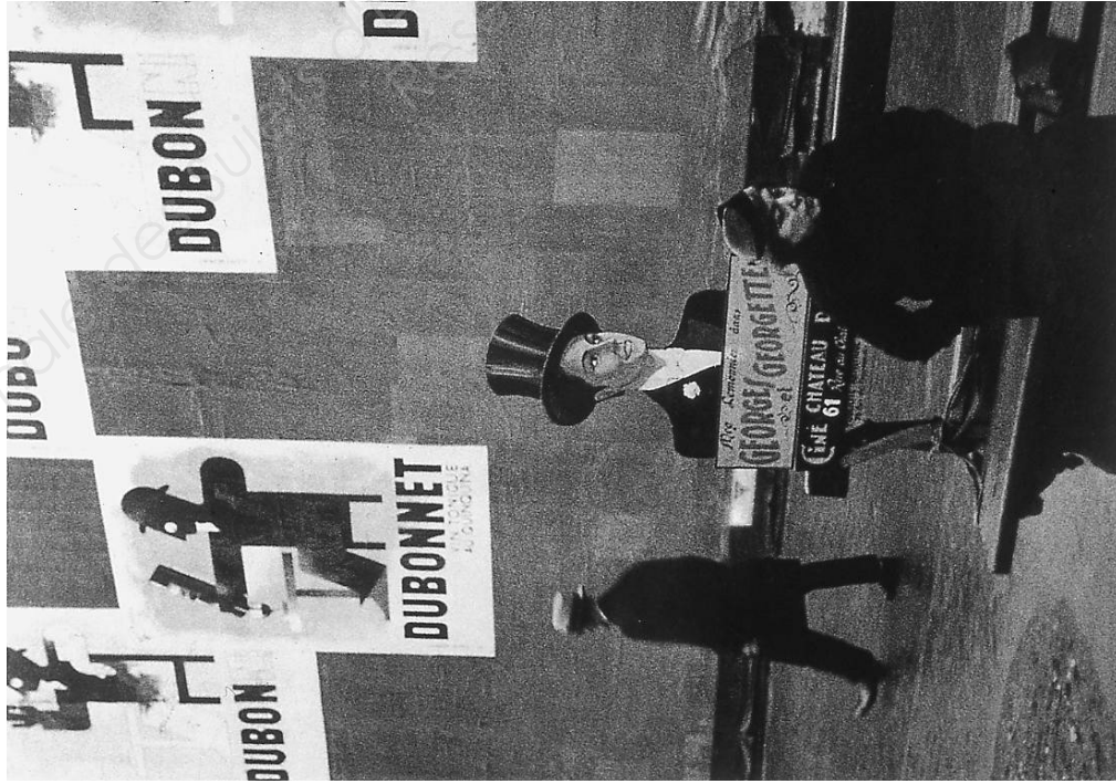
André Kertész, Du bon Dubonnet , Paris, 1928