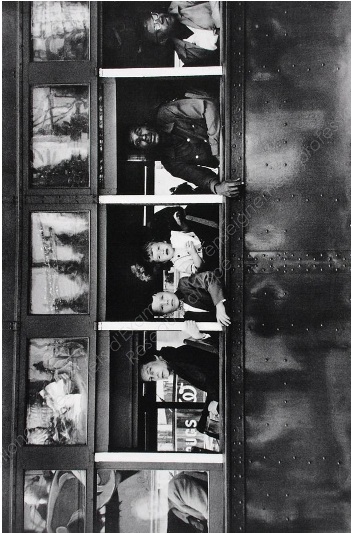
Robert Frank New Orleans, États-Unis, 1958