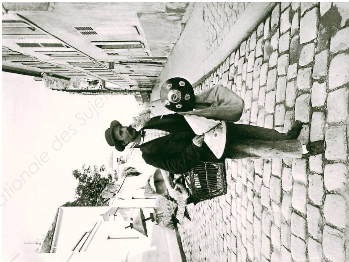
Eugène Atget, Marchand d'abat-jour, Paris, rue Lepic, Série des petits métiers, 1898