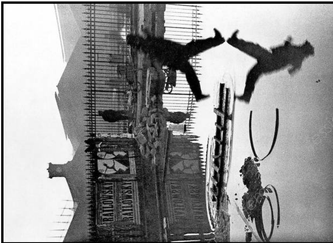
Henri Cartier Bresson, Derrière la gare St Lazare, Paris, 1932