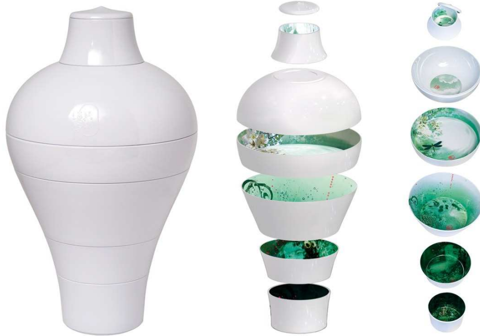
Doc. 1. Vase Ming – Ibride. Ensemble en mélaminé.