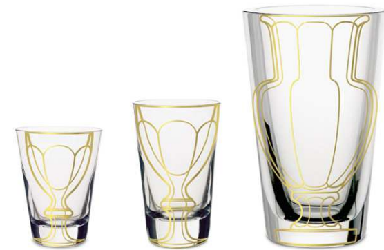
Doc. 3. Apparat – 5.5 designers pour Bacc