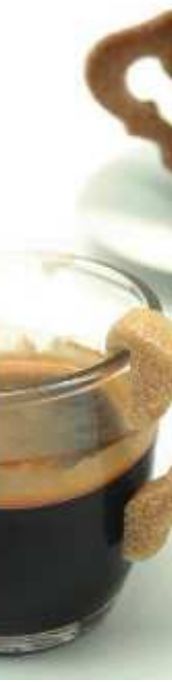
Doc. 2. Les objets ordinaires : anses d