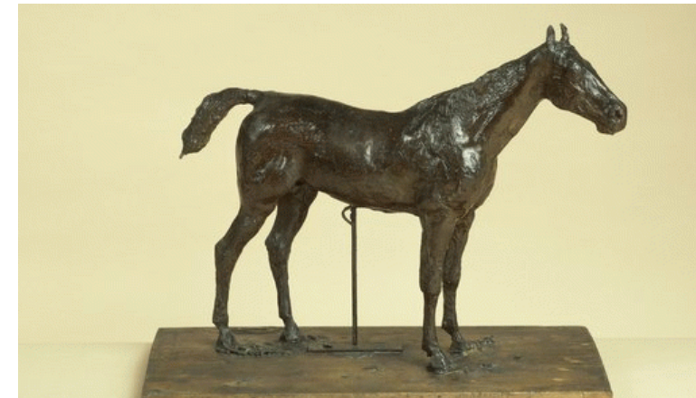
8 – Degas, « Cheval à l'arrêt », 1870 cire, 31 x 39 x 19 cm, musée d'Orsay