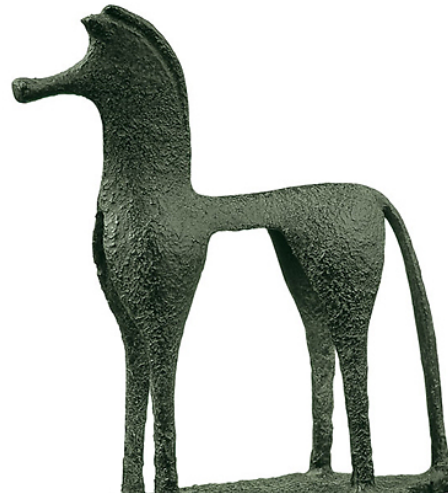
2 - « Cheval grec », 7 e s. av. J.C. bronze, 12 x 9 x 5,5 cm, Musée Guimet