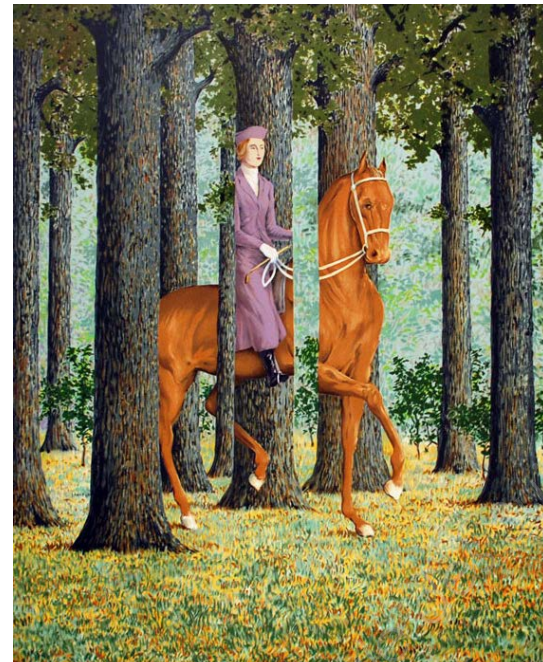
13 – Magritte, « Le blanc seing », 1965 huile sur toile, 81 x 64, Washington