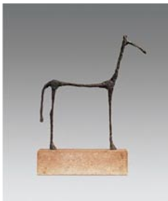
12 – Giacometti, « Cheval », 1954 bronze