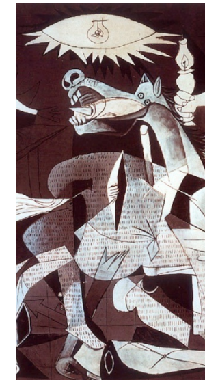
11 – Picasso, « Guernica » (détail), 1925 peinture à l'huile, 349,3 x 776,6 cm, Madrid