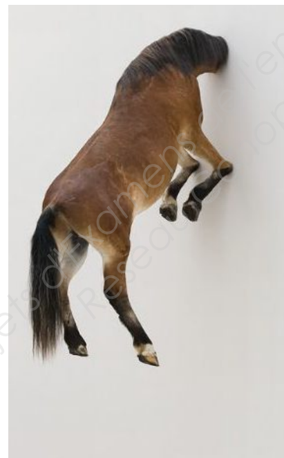
14 - Maurizio Cattelan, "Kaputt", 2009, cheval taxidermisé, Fondation Beyeler Bâle