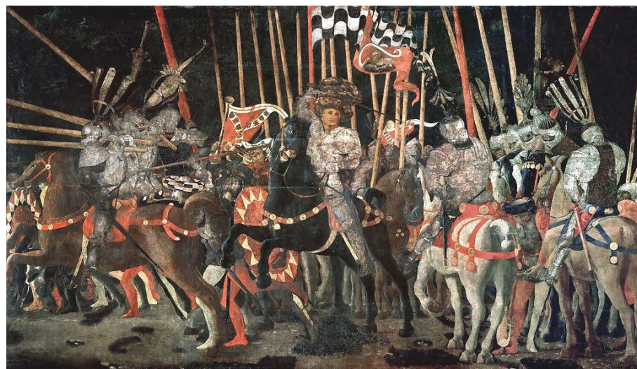
4 – Uccello, « La bataille de San Romano », 1435-1440 huile sur bois, 182 x 317 cm, musée du Louvre