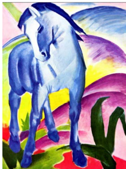
9 – Franz Marc, « Le cheval bleu », 1911 Huile sur toile, 112 x 84 cm, Munich