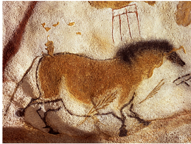
1- « Cheval chinois », 18.000 ans avant J.C, art pariétal, Grotte de Lascaux