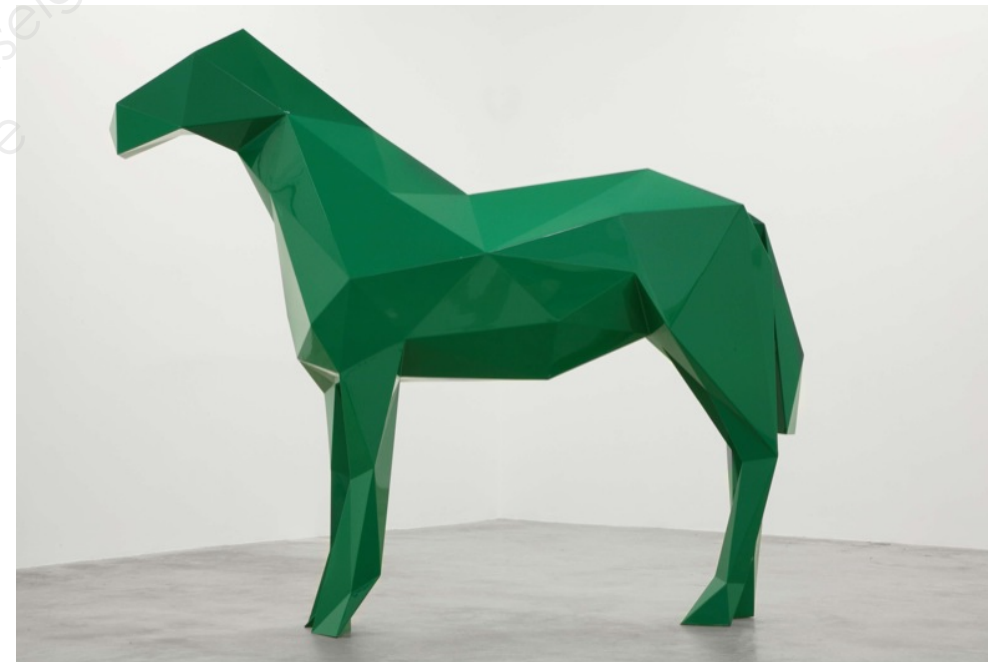
15 – Xavier Veilhan, "The horse", 2009 tôle d'acier peint, 200 x 260 x 60 cm, Montréal