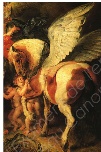
5 – Rubens, « Persée et Andromède » (détail), 1620 peinture sur bois, 99 x 139 cm, musée de l'Hermitage