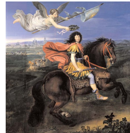
6 - Mignard, « Louis XIV devant Maëstricht », 1673 huile sur toile, 311 x 301 cm, Versailles