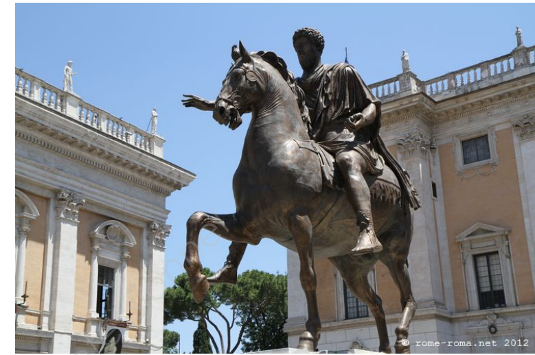
3 – « Statue équestre de Marc-Aurèle », 160 après J.C bronze, Capitole, Rome