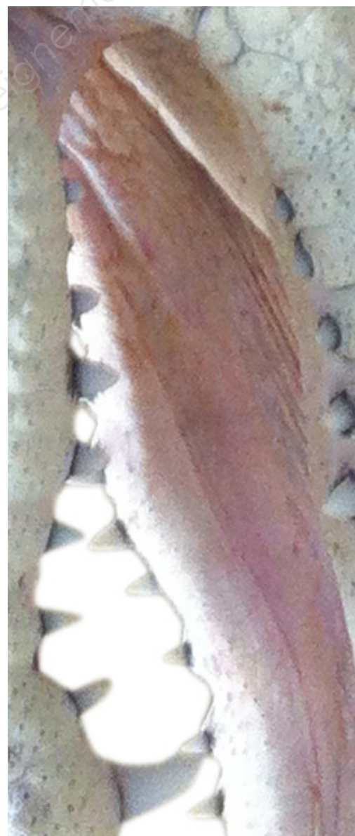
Document ressource n°7 - Gros-plans du crocodile à reproduire