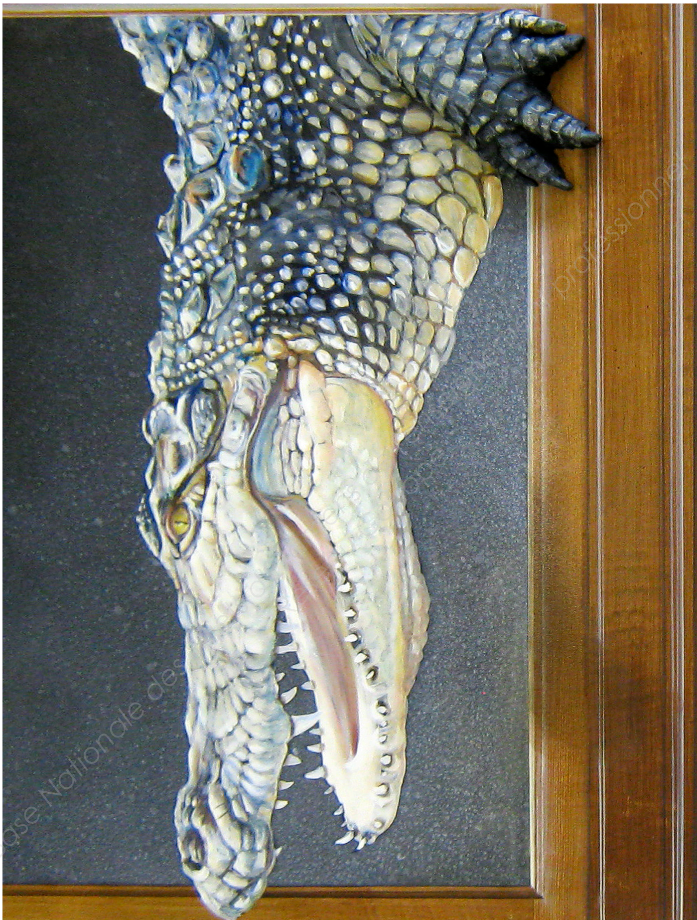
Document ressource n°5 - Détail du crocodile, de la patte et du fond à reproduire.