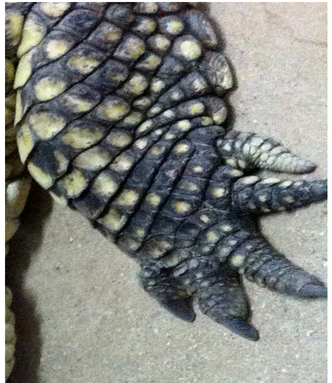
Document ressource n°6 – Photographie du crocodile et de la patte à reproduire