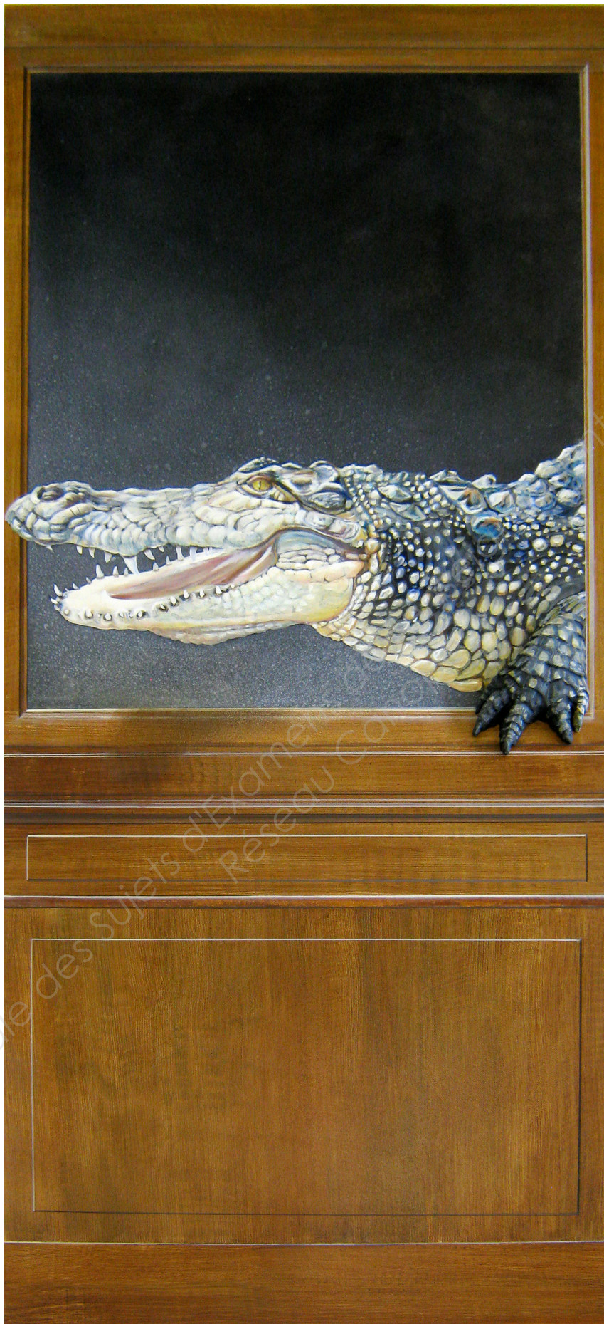
Document ressource n°3 – Décor de la porte à reproduire.