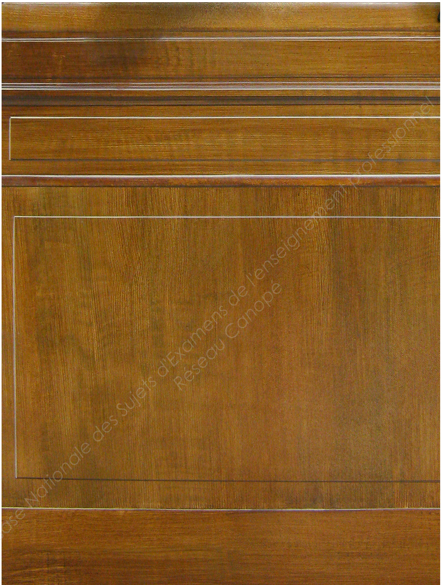
Document ressource n°4 - Détail du bois et des boiseries à reproduire.