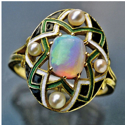
Bague Georges Fouquet – 1905 Or, opale, perles, émail Tadema Gallery, Londres