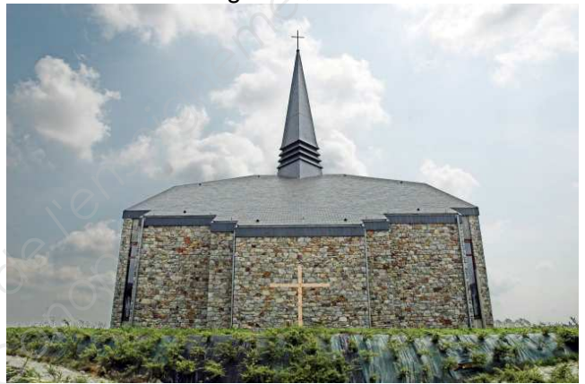
Document B - Louvain