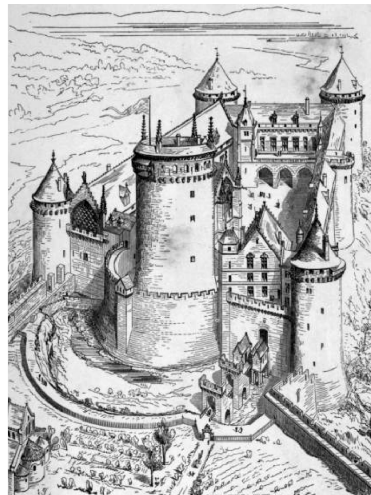
Document C - château de Coucy