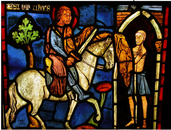
Document 2 - Cluny - 1220