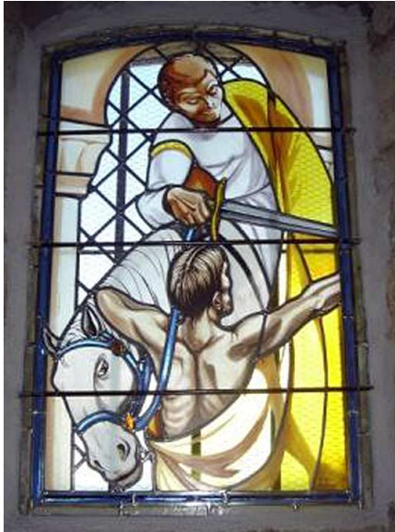
Document 1 - Boussac St Affrique - 1999