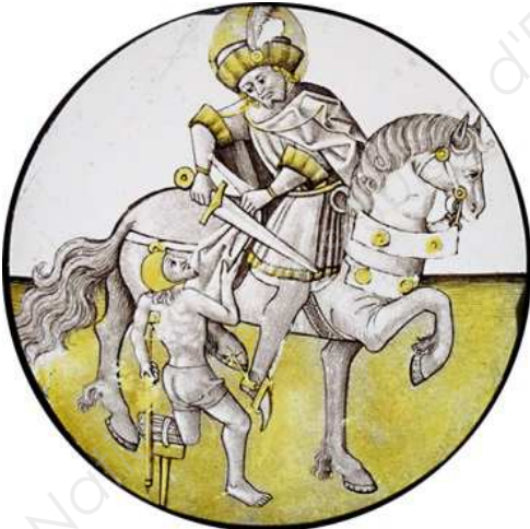
Document 3 - V&A museum 1490