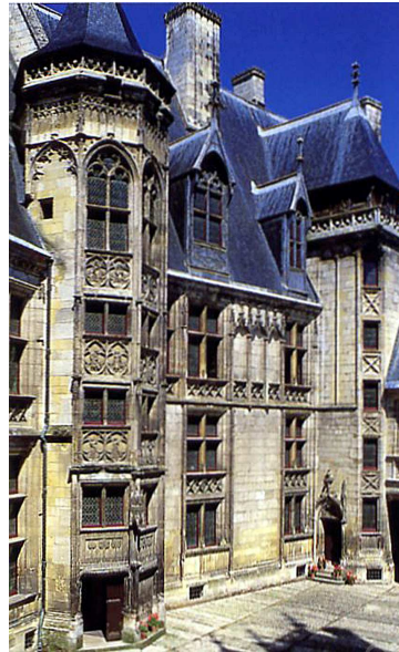
Document A - Bourges