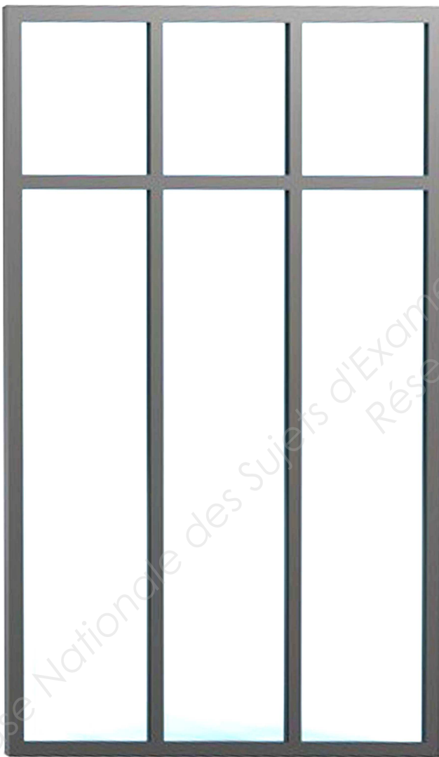
1 ère proposition de composition

A partir des relevés précédents, et en fonction du sujet et du cahier des charges, vous esquissez en couleurs, deux propositions de compositions sur les deux schémas reproduits ci-dessous.