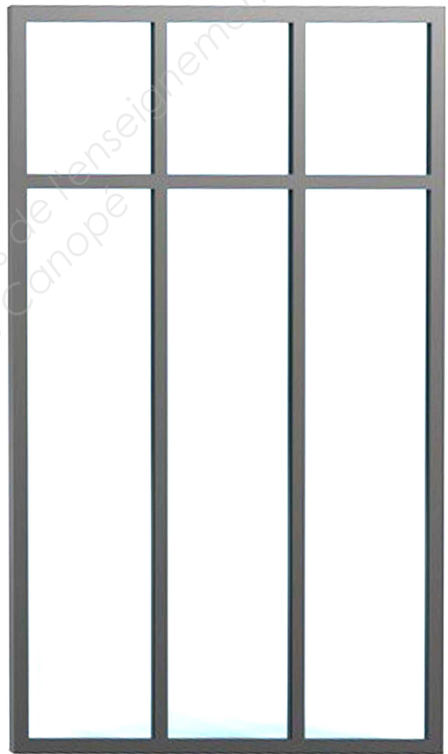
2 ème proposition de composition