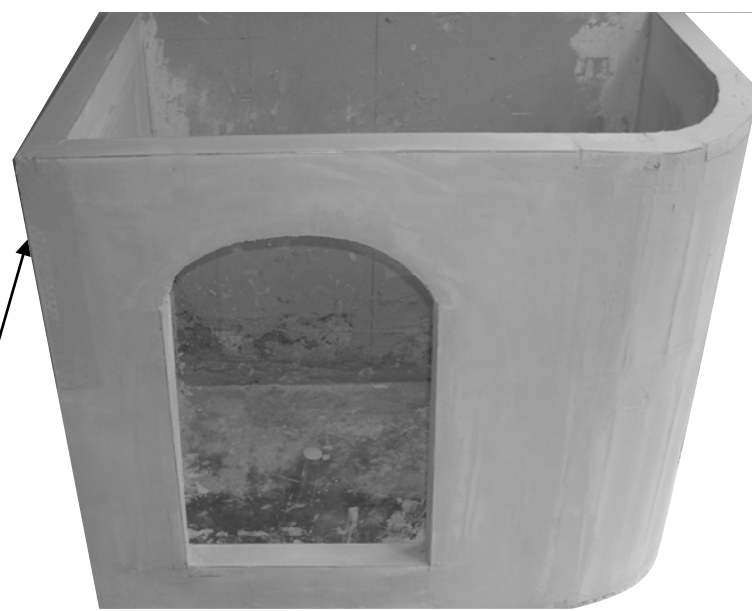
Photographie de l'ouvrage