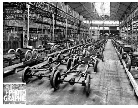
Usine Citroen 1920 - Paris