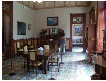
Un intérieur art déco