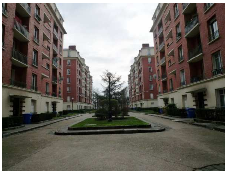
Cité jardin - Asnières 1920-27

vec le développement de l'industrialisation, la mécanisation, les capacités de production augmentent et permettent la production d'objets en série.