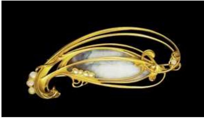
ART NOUVEAU - Hector Guimard, broche 1909

Lassés des complications formelles du style « Art Nouveau » qui précédait, qu'ils qualifièrent de « style nouille » à cause de ses formes courbes, molles et surchargées, les artistes et créateurs se sont employés à simplifier l'aspect de leurs productions.