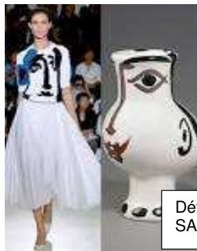
Défilé Jil SANDER 2012