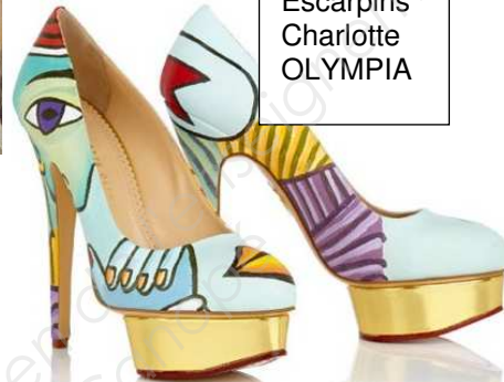
Escarpins Charlotte OLYMPIA