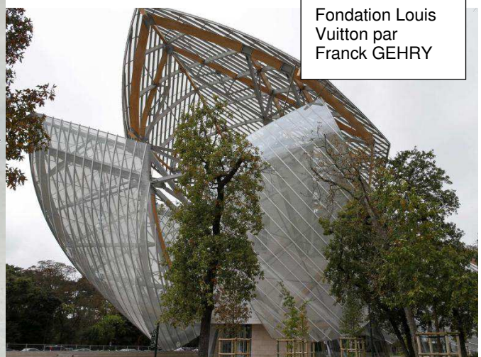
Fondation Louis Vuitton par Franck GEHRY