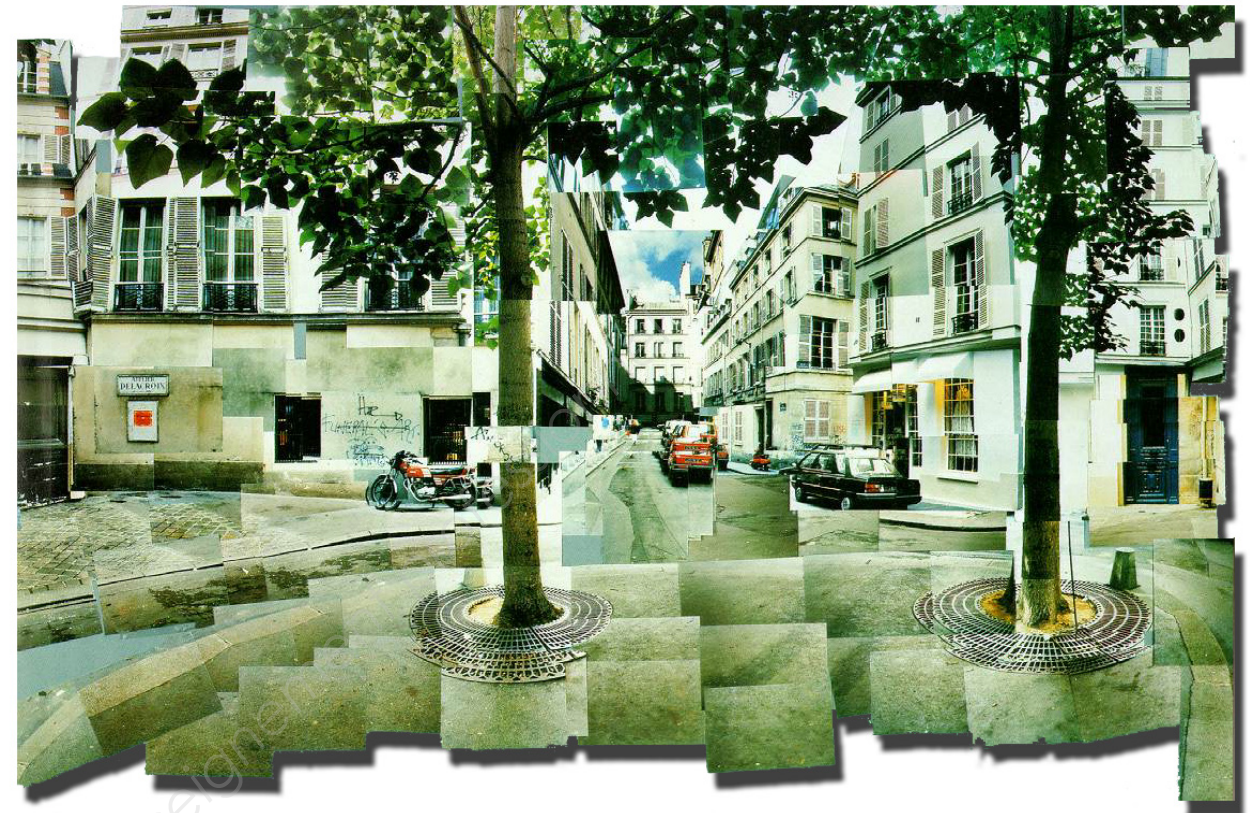
7 David Hockney, Place Furstenberg à Paris , 1985.