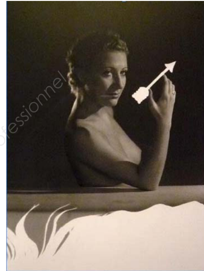
2 Dora Maar, Jacqueline Lamba de profil une flèche aux doigts , 1930.