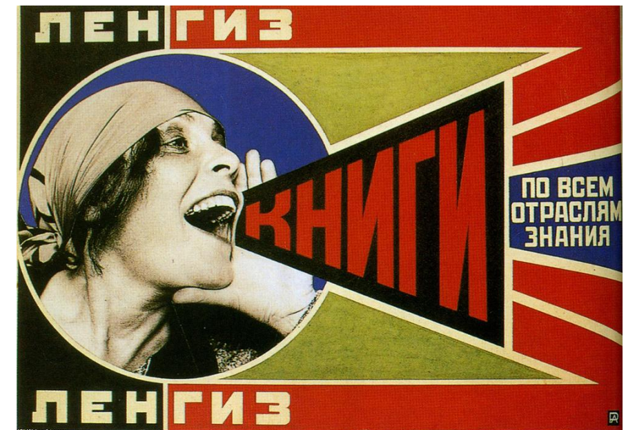
5 Alexander Rodtchenko, Plakat , 1924, affiche et couverture de livre.