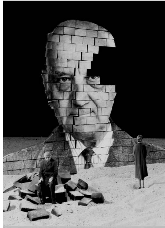
6 Gilbert Garcin, Travail en cours , 1999.