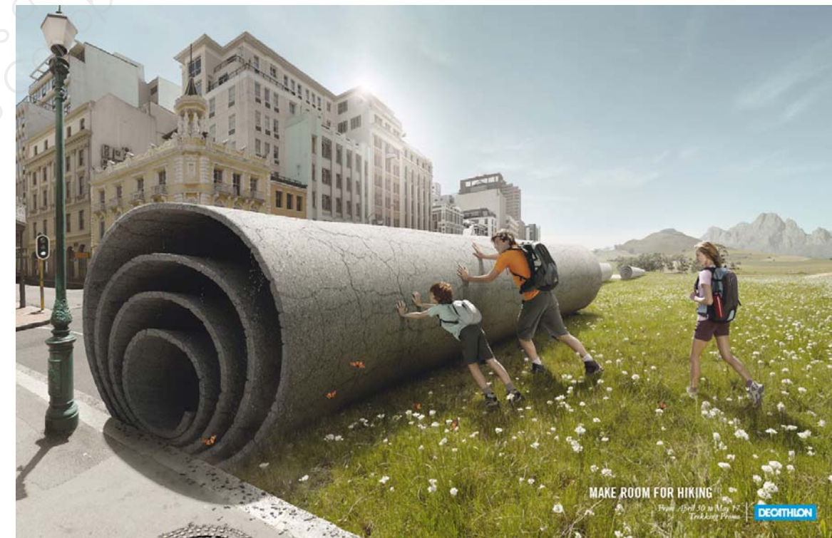
9 Campagne publicitaire pour Décathlon, Agence Young et Rubicam, 2010.