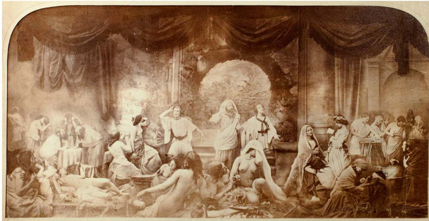
1 Oscar Gustav Rejlander, Les deux chemins de la vie , 1857, photographie réalisée à partir de 25 négatifs.