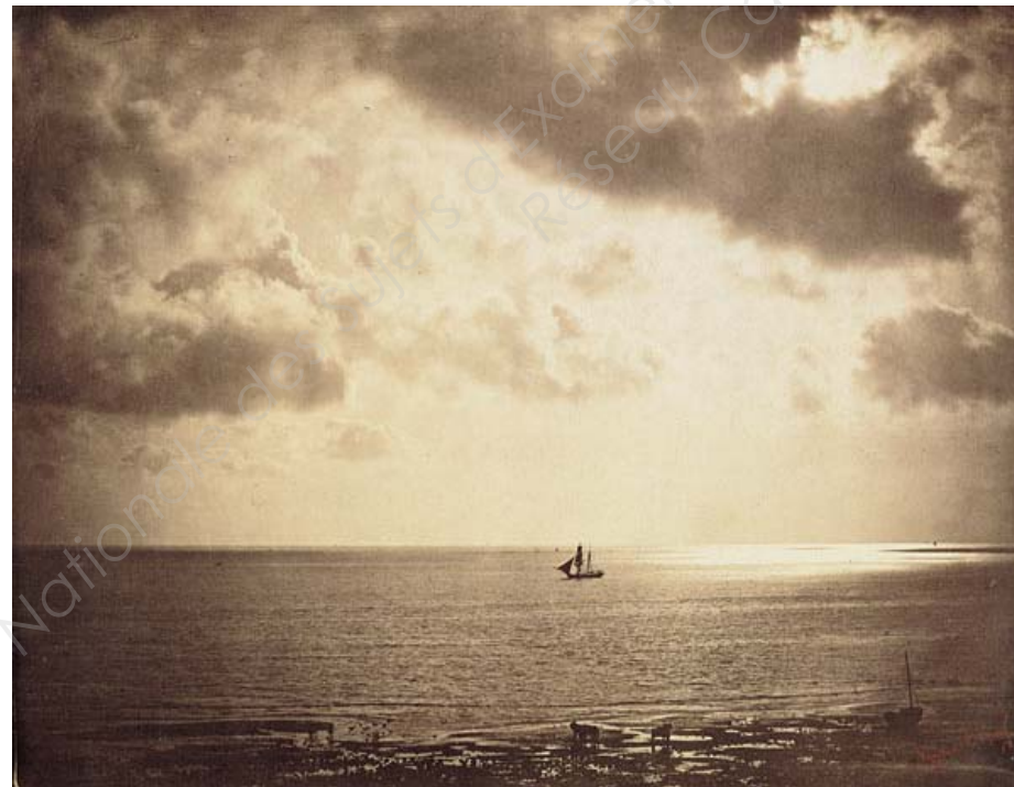
4 Gustave Legray, Brick au clair de lune , Sète, 1856.