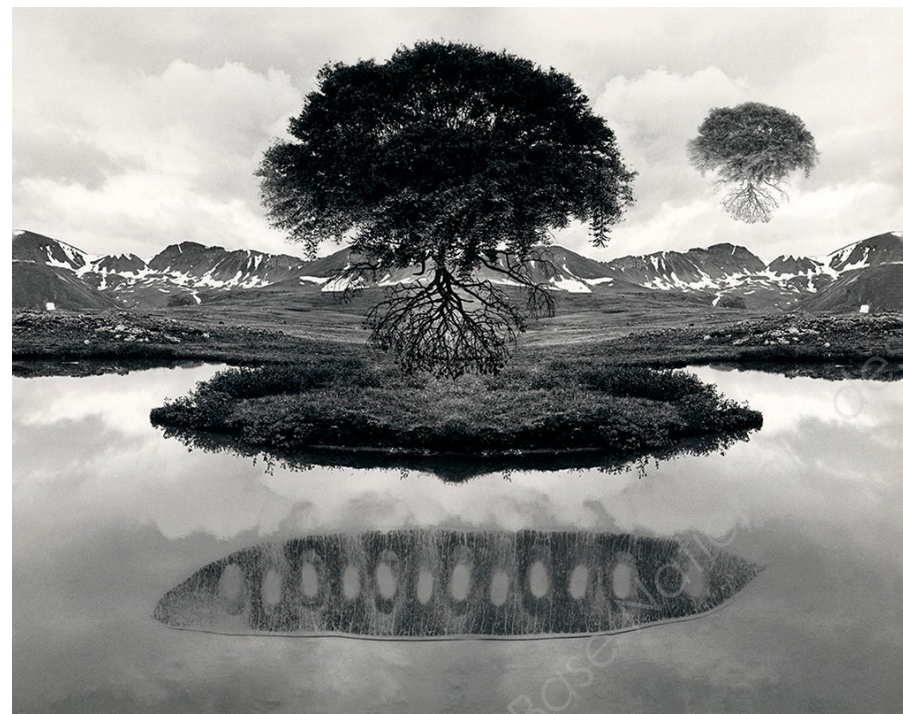
8 Jerry Uelsmann, Sans titre , 1969.