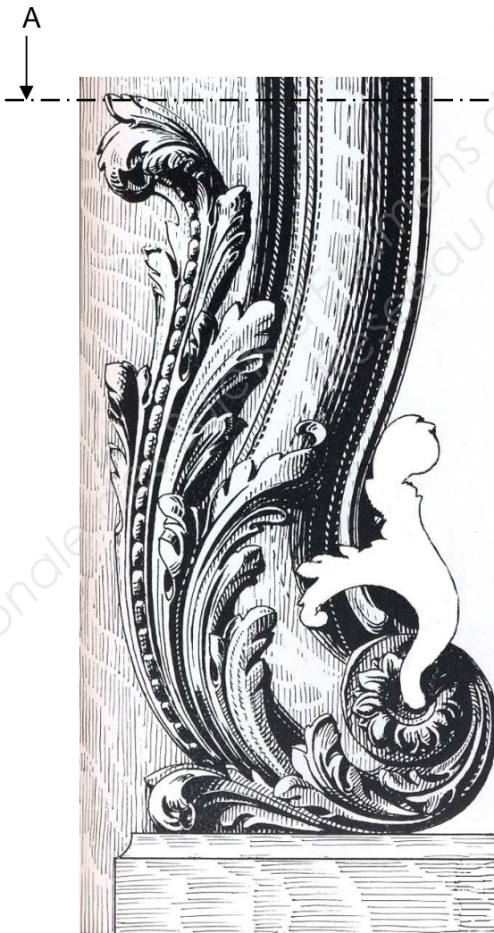
Bas de glace Louis XIV