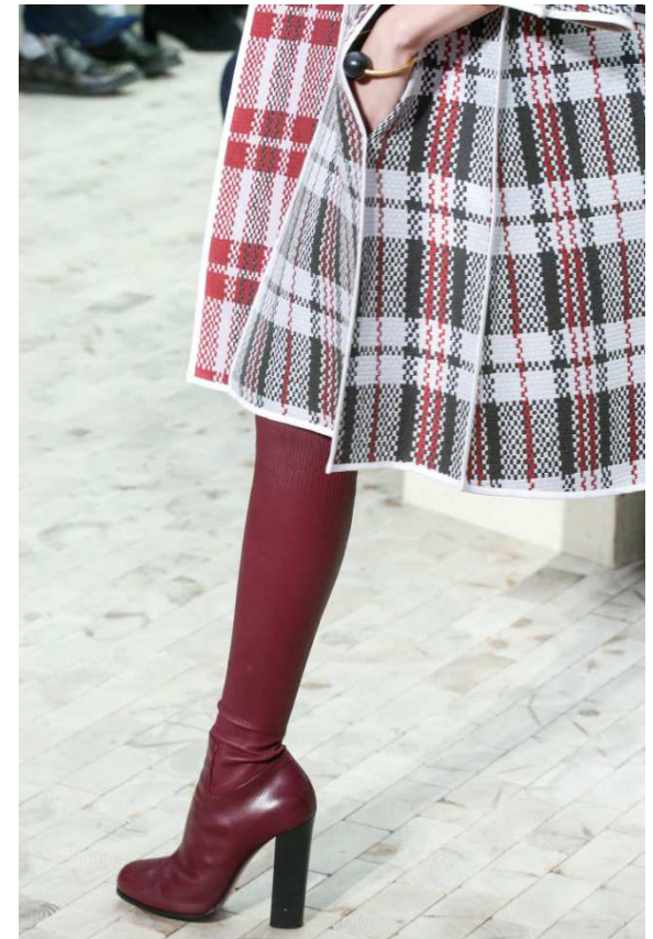
SÉRIE A- Document 1 – CÉLINE, manteau en jacquard de soie double face, collection automne-hiver 2013.