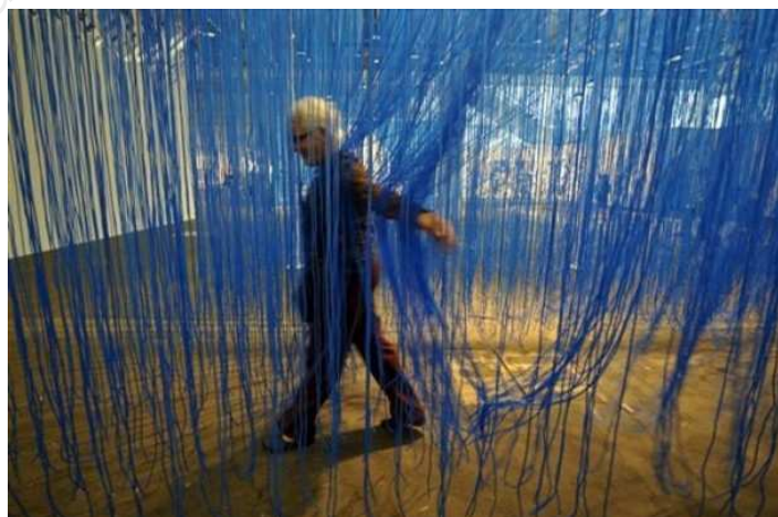
Jesús Rafaël Soto – Pénétrable BBL , 1999, installation sonore, 3.65 x 4 x 10 m. Edition Avila (succession Soto) 2007.