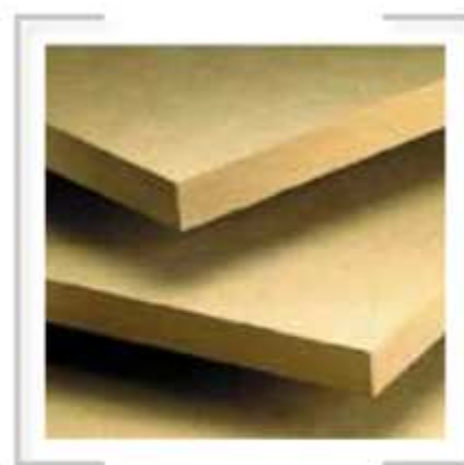
plaques de MDF