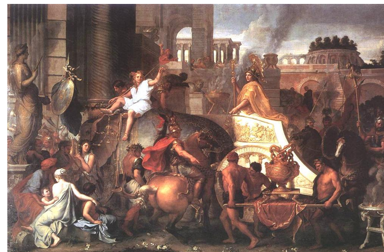
Charles Le Brun « Entrée d'Alexandre dans Babylone »