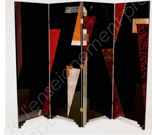
Paravent à décor de laque Années 30

« Nous dinâmes un jeudi soir chez Matisse, quai St Michel, Salmon, Apollinaire, Picasso et moi. Matisse prit sur un meuble une statuette de bois noir et la montra à Picasso »... « Picasso la tint à la main toute la soirée. Le lendemain matin, quand j'arrivai à l'atelier, le plancher était jonché de feuilles de papier Ingres. Sur chaque feuille un grand dessin, presque le même ; une face de femme avec un œil, un nez trop long confondu avec la bouche, une mèche de cheveux sur l'épaule »... « Cette même femme reparut sur des toiles. Au lieu d'une femme, il y en eut deux ou trois. Puis il y eut Les demoiselles d'Avignon, tableau grand comme un mur. » Extrait de « Naissance du cubisme » par Max Jacob Les nouvelles littéraires 1928