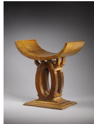
Pierre Legrain Tabouret curule