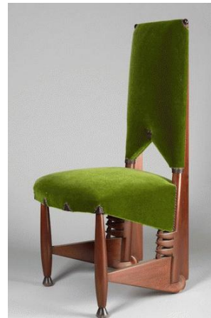
Chaise en acajou par Michel de Klerk 1915