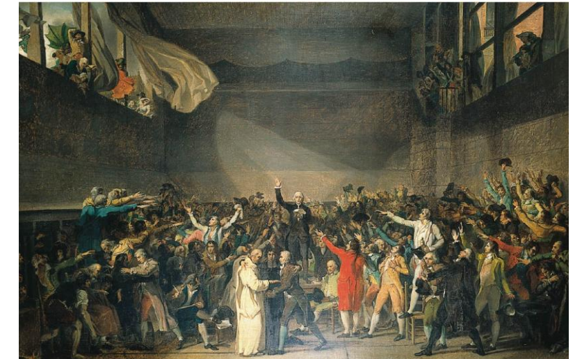
« Le serment du jeu de paume » par Jacques Louis David