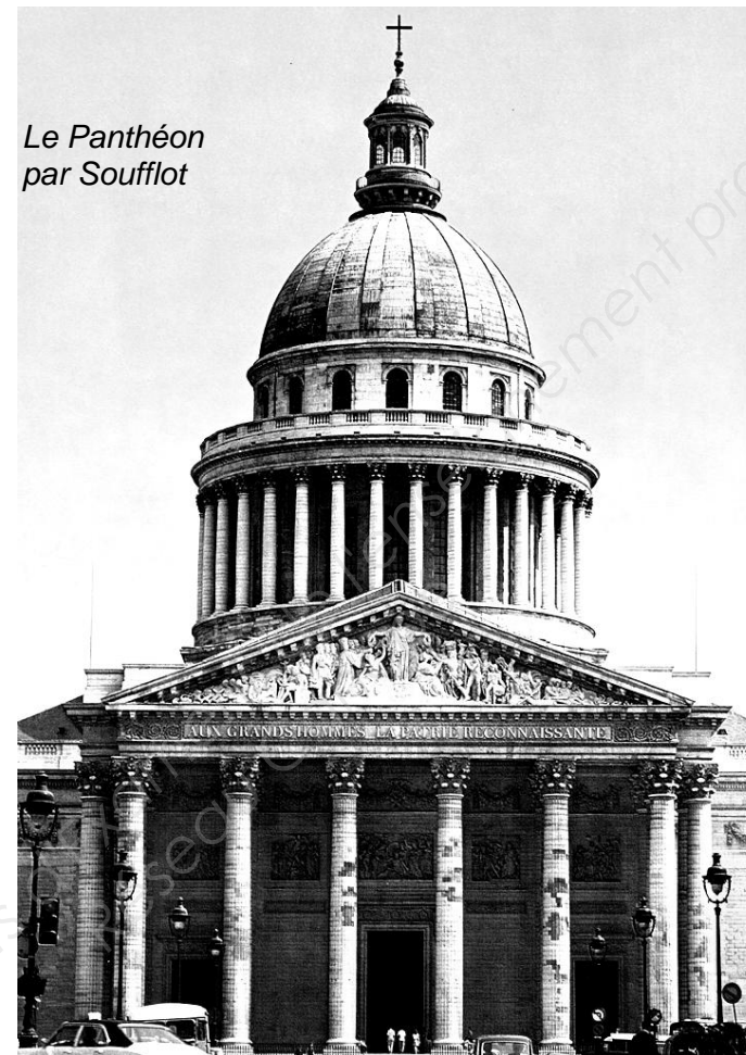
Le Panthéon par Soufflot