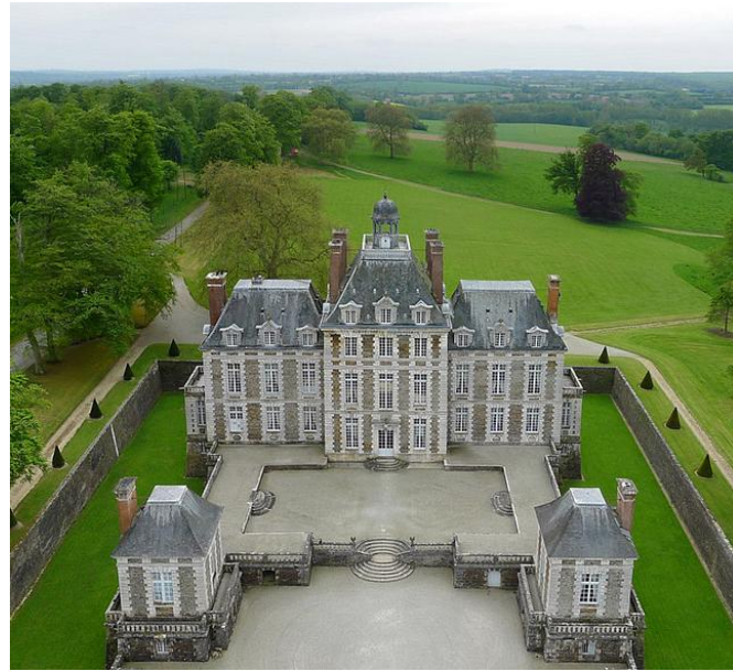
Château de Balleroy par François Mansart