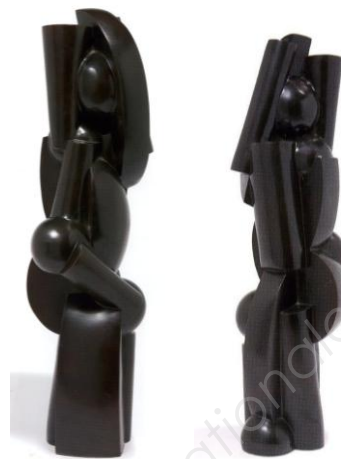
« Figure, cônes et sphères » 1919 Joseph CZAKY 1888-1971