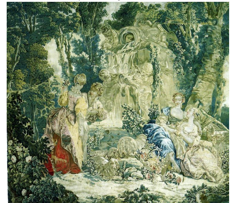
Tapisserie de Beauvais « la fontaine d'amour » d'après François Boucher