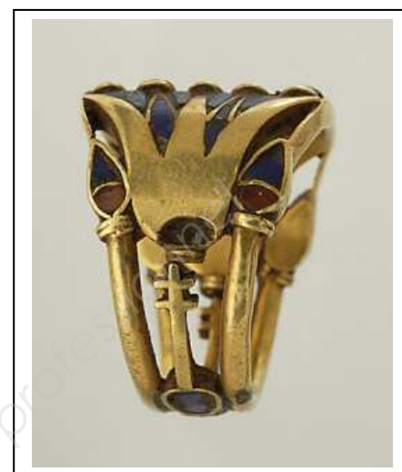
BIJOU N° 3