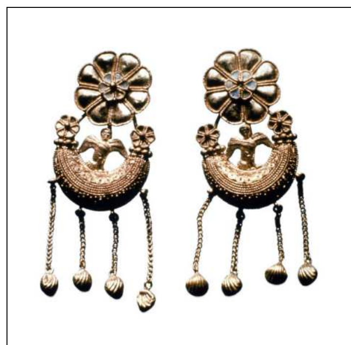
BIJOU N° 5