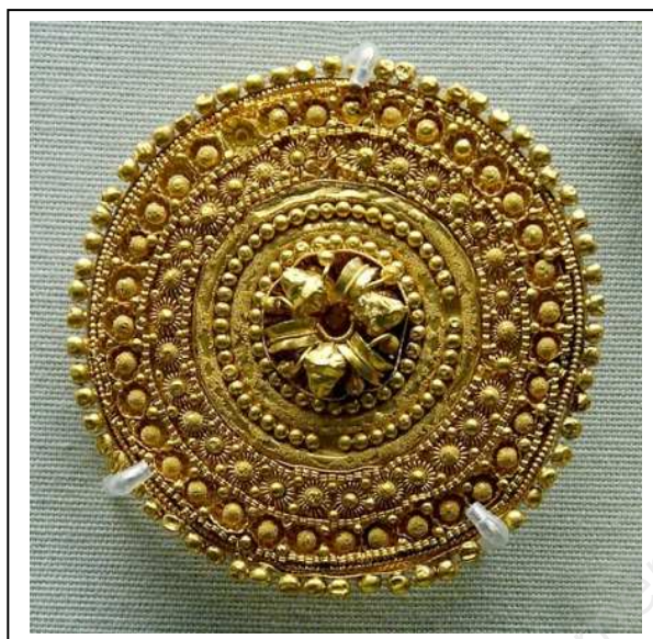
BIJOU N° 2