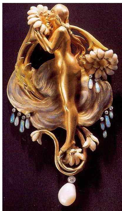
BIJOU N° 1