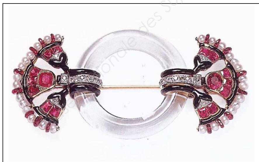
BIJOU N° 4