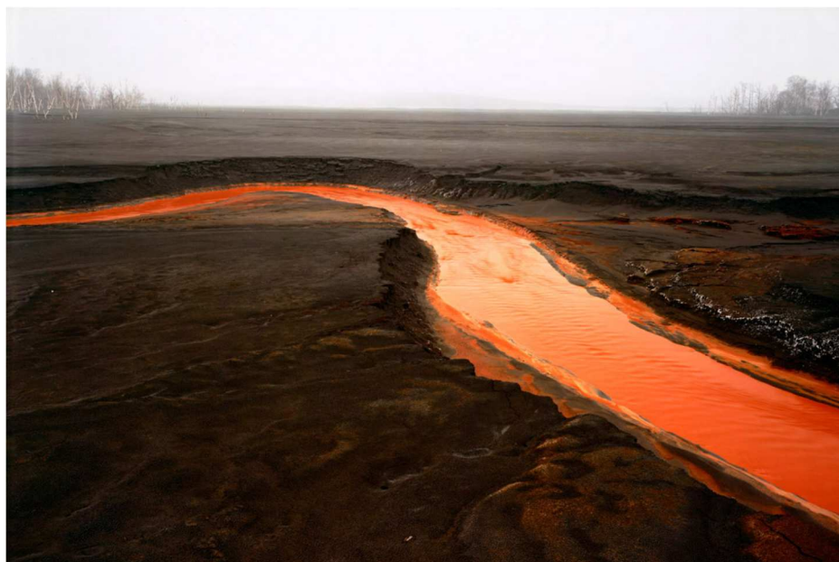
Doc. 6: Edward Burtynsky, Nickel Tailings (Résidus de nickel) No. 35, Sudbury, Ontario, Canada , tirage couleur chromogène, 1996