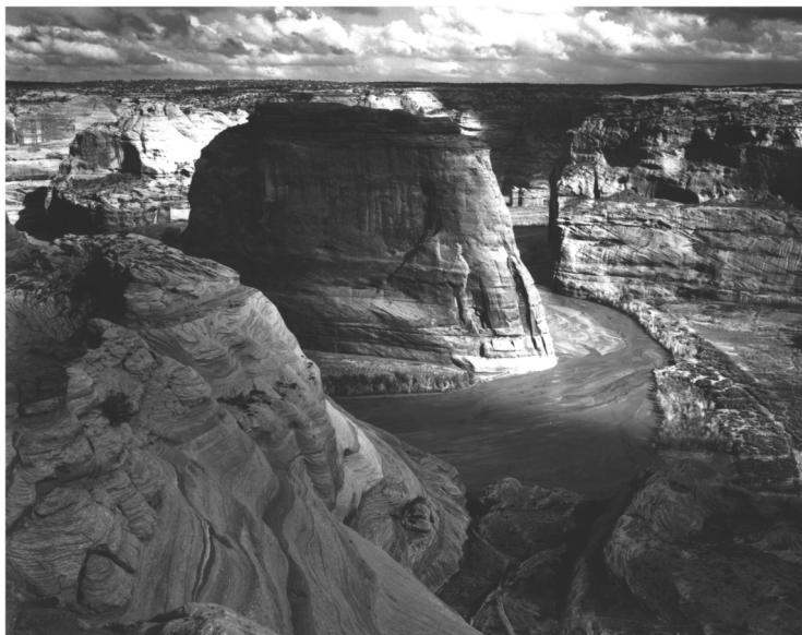
Doc. 4: Ansel Adams , Canyon de Chelly , épreuve gélatino-bromure, 1941.