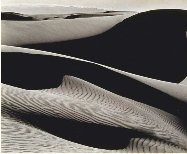
Doc. 1: Edward Weston, Dunes, Oceano , épreuve gélatino-bromure - 1936 .