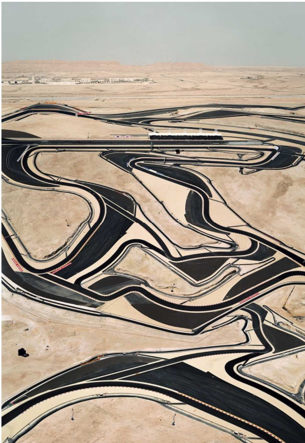
Doc.3 : Andreas Gursky, Bahrain I , tirage numérique couleur, 2005