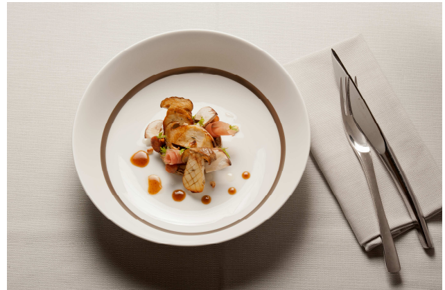
Le plat du chef