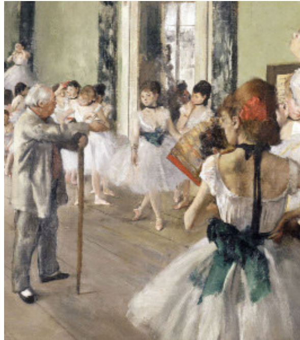
La classe de danse, Degas 1873-75 85 x 75 cm Musée d'Orsay, Paris

1. Répondez aux questions portant sur ces quatre oeuvres.