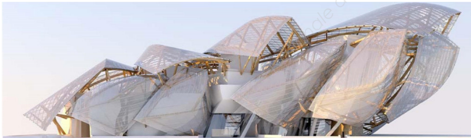
Fondation Louis Vuitton Octobre 2014