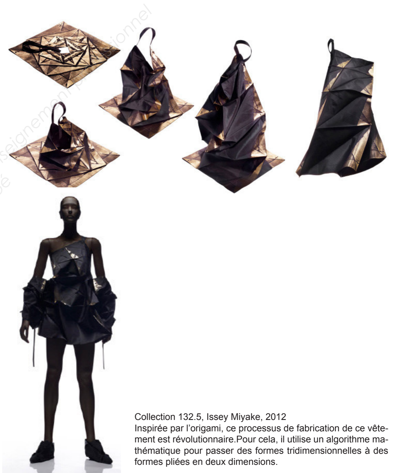
Collection 132.5, Issey Miyake, 2012 Inspirée par l'origami, ce processus de fabrication de ce vêtement est révolutionnaire. Pour cela, il utilise un algorithme mathématique pour passer des formes tridimensionnelles à des formes pliées en deux dimensions.