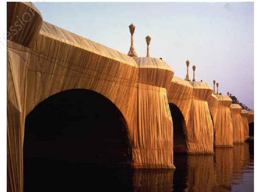
Le Pont Neuf est emballé par Christo, 22 septembre 1985