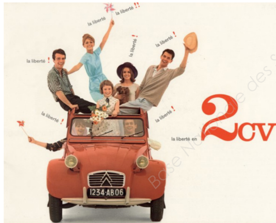
Plaquette pour le catalogue de La 2cv Citroën - 1961

Observez le visuel publicitaire ci-dessous et démontrez l'évolution du statut de la femme.