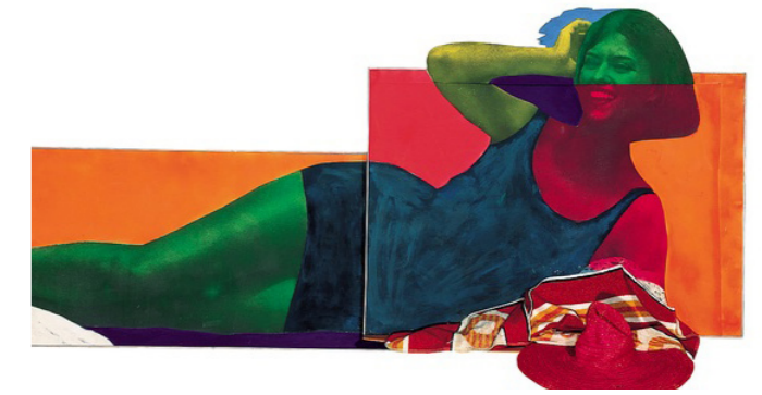
« Soudain l'été dernier » - 1963

e- Citez deux autres artistes de ce mouvement :