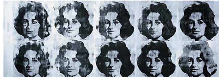
Actrice américaine Elisabeth Taylor « Ten Lizes » - 1963

c- Commentez le statut de la femme dans l'œuvre ci-dessus :