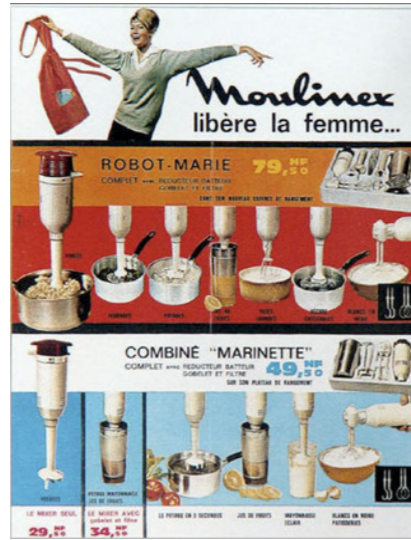
Moulinex libère la femme affiche publicitaire Moulinex - 1956