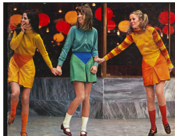
Photographie pour le magazine Jour de France la guerre des mini-jupes, 1967