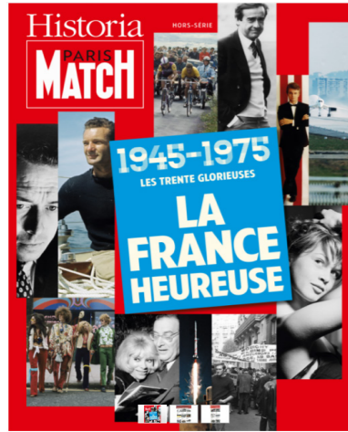
Historia, Paris Match La France heureuse, Hors-séries

C'est la décennie de tous les changements dans la période des « Trente Glorieuses ». Le pays connaît une évolution dans de nombreux domaines et la société se transforme.