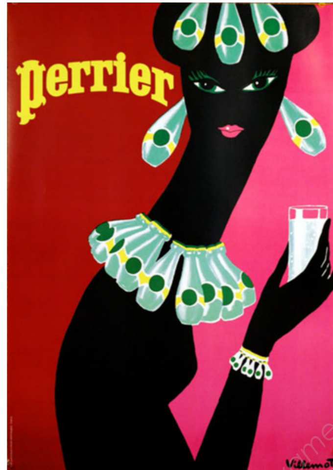
Perrier c'est fou Femme au collier - 1977