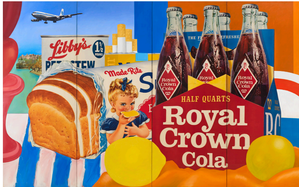
Doc. n°1 - Affiche publicitaire de divers produits pour un grand magasin américain - Années 60