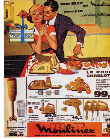
Moulinex, appareils électro-ménager Affiche publicitaire - 1960