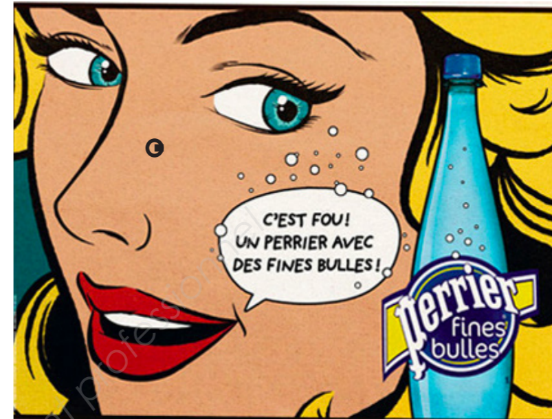
Affiche Publicitaire pour « Perrier » 2015