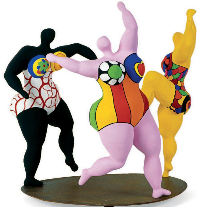
« Les Trois Grâces » - 1999 Niki de SAINT PHALLE,

Elle sculpte ses œuvres dans des blocs de polystyrène, recouvre cette base de laine de verre et de résine polyester pour la rendre dure comme la pierre. Les « Nanas » sont ensuite peintes de couleurs vives ou décorées de morceaux de céramique colorée, des miroirs, des billes de verre.