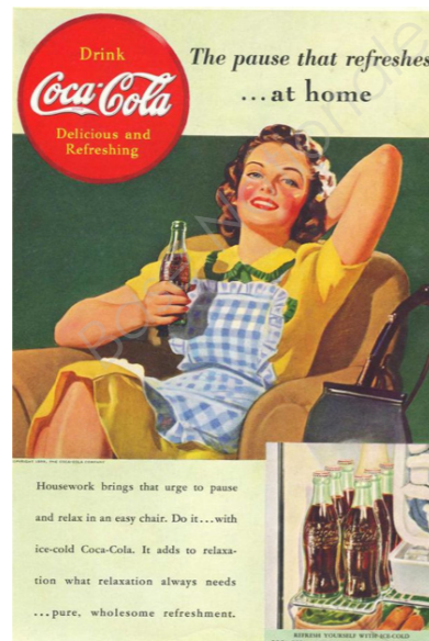
Affiche publicitaire Coca Cola début des années 60