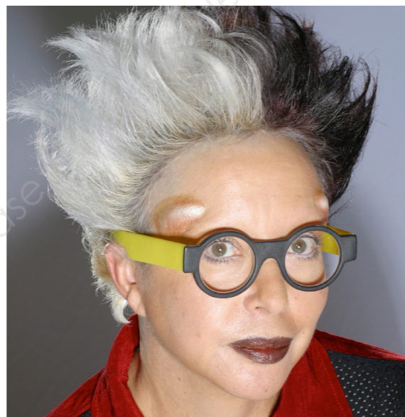
Femme scarifiée - ORLAN C'est en 1964, la jeune femme réalise ses premières œuvres photographiques