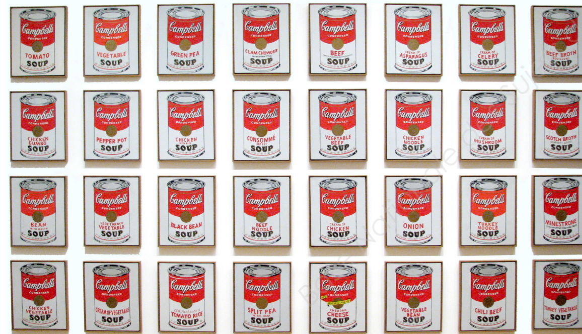
Doc. n°2 - « Campbell's Soup Cans » - Andy Warhol - 1962

Lieu d'exposition : Musée d'art moderne de New York Dimension : 32 toiles de 50,8cm par 40,6cm Type : 32 toiles d'acrylique peinte,