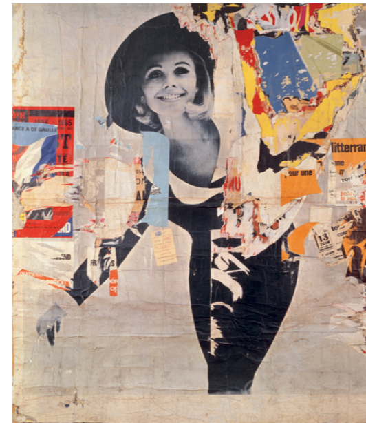
« La Femme » - 1966

d- Citez deux autres artistes de ce mouvement :