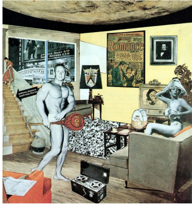
« Qu'est-ce qui rend nos foyers aujourd'hui si différents, si attirants ? » Collage 1956 - collection privée