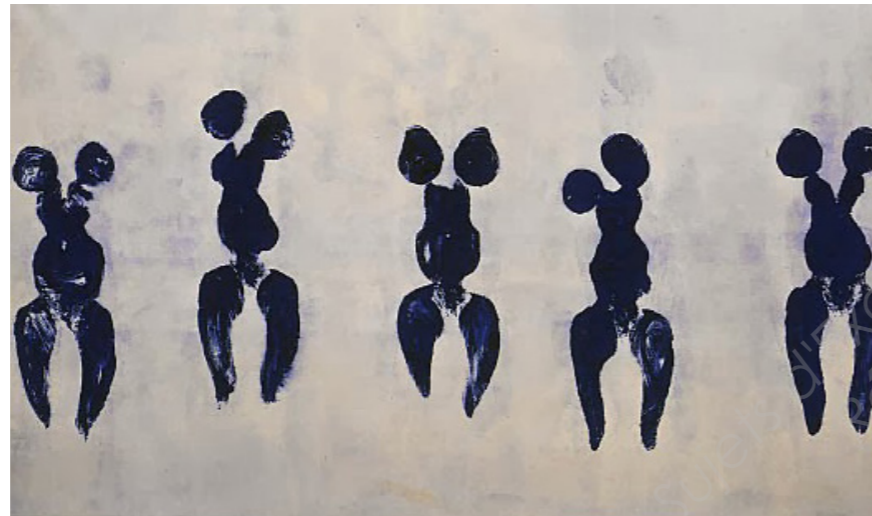
« Anthropométrie » - 1960 Photographie d'une performance d' Yves Klein et ses modèles

Elle sculpte ses œuvres dans des blocs de polystyrène, recouvre cette base de laine de verre et de résine polyester pour la rendre dure comme la pierre. Les « Nanas » sont ensuite peintes de couleurs vives ou décorées de morceaux de céramique colorée, des miroirs, des billes de verre.