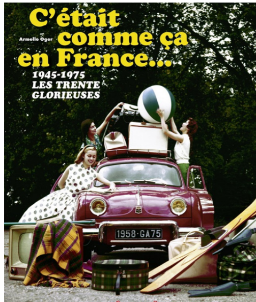
Couverture du livre C'était comme ça en France... Armelle Ogier