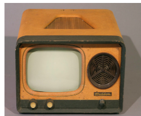
Téléviseur Hudson début des années 60

Viens m'embrasser Et je te donnerai Un frigidaire Un joli scooter Un atomixaire Et du Dunlopillo Une cuisinière Avec un four en verre Des tas de couverts Et des pelles à gâteaux