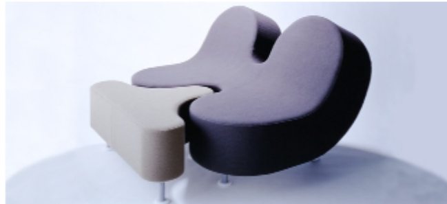
4) Claudio Colucci, « A bout de souffle »