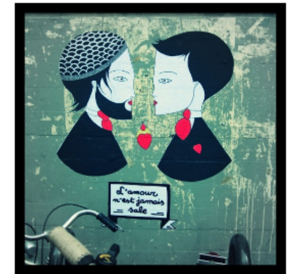
Binôme 4 Fred Le Chevalier, Street Art www.lumieresdelaville.net