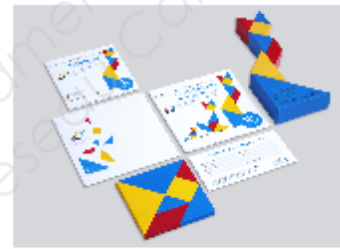
RMG Design, ligne graphique des 10 ans du prix de la réadaptation professionnelle organisée par l'Assurance Invalidité du canton