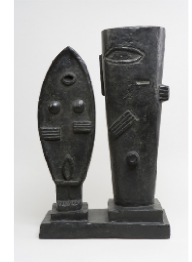
Binôme 2 Giacometti, Le Couple, 1927