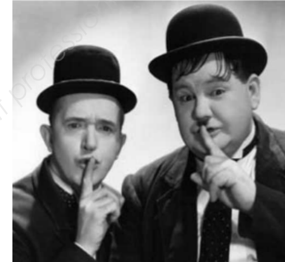
Binôme 1 Laurel et Hardy, duo comique, 1927