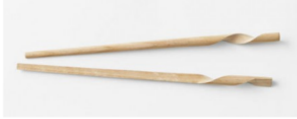
2) Oki Sato, Baguettes chinoises