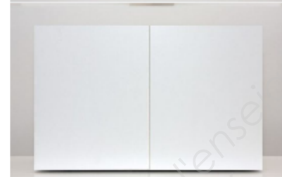
6) Mattias Stenberg, tabouret Within