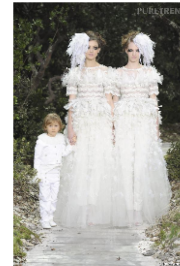
Binôme 3 Chanel, Haute Couture Printemps-Eté 2013