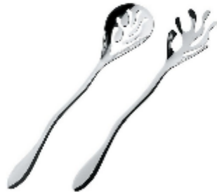
5) Silvestris Emma, couverts à salade