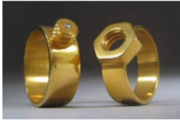
1) Kiley Granberg, « vis-ecrou-boulon », alliance