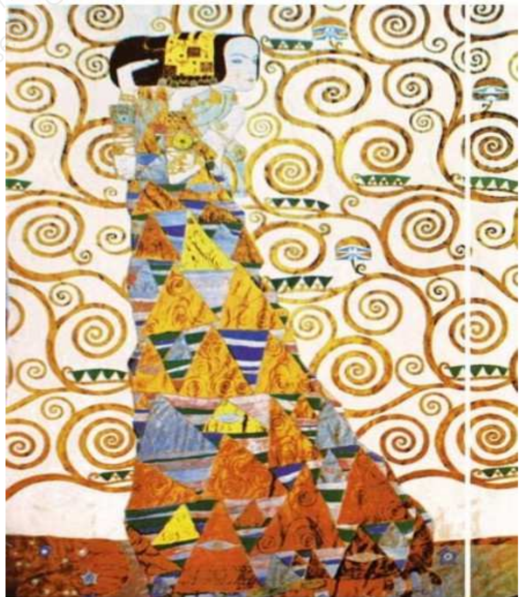
Détails sur la droite de la toile