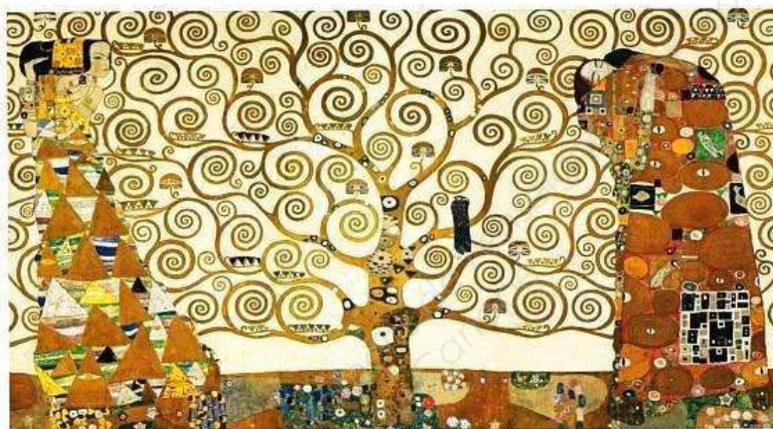
L'arbre de vie (1905-1909), de Gustave Klimt