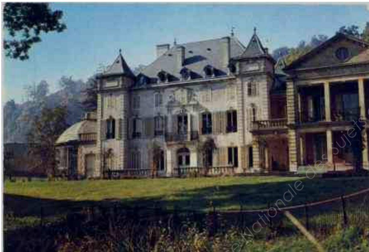
Château de Gentilly Maxéville (54)

Seule la page du DEO 6/6 est fournie en version papier et imprimée en couleur.