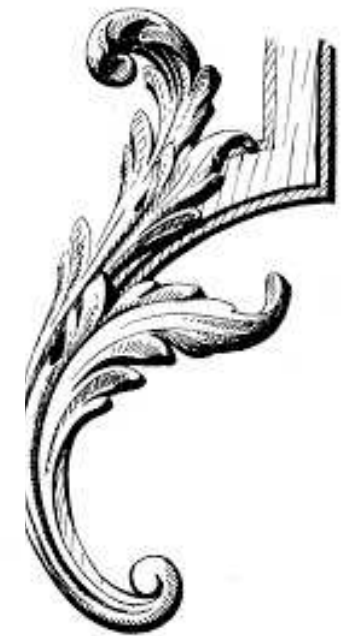
planche documentaire ornements