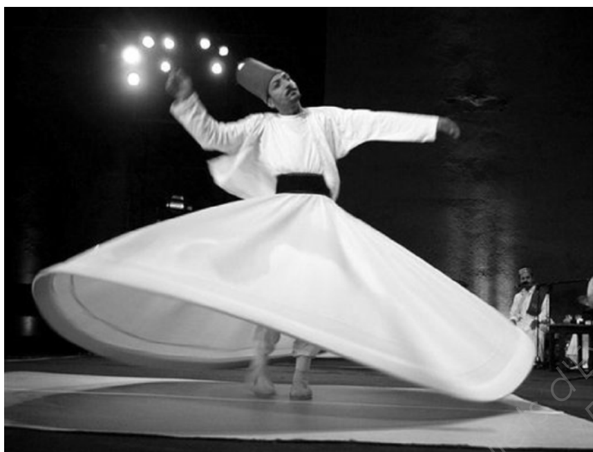
Derviche Tourneur – Turquie

A l'occasion du festival de représentations des danses de Derviches Tourneurs, les organisateurs font réaliser des toupies en bois en forme de personnages. Celles-ci seront vendues en boutique et chaque spectateur pourra les essayer.