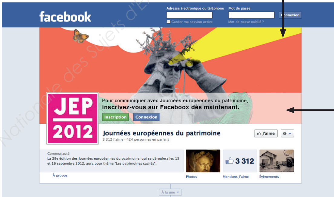
Question « 6h » et question « 6g »