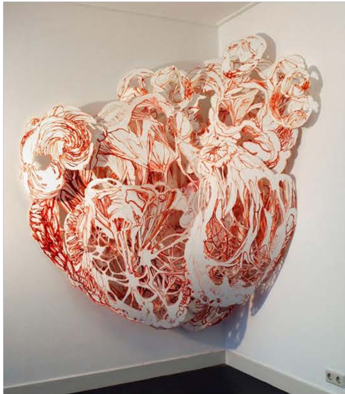
Joris KUIPERS , Monumental wall-relief , sculpture papier, 2013