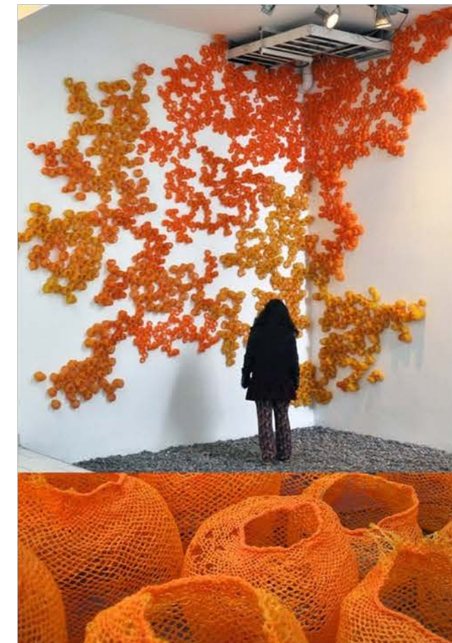
SILVA GUZMAN Andrea, Proliferacion , 2010-11, 5 m2 de plastique tissé pour emballage de fruits et de légumes, traité thermiquement avec une idée de prolifération et de saturation de l'espace.