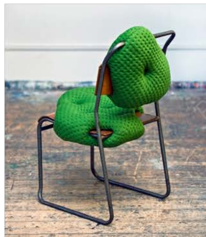
Charlotte KINGSNORTH , Hybreed , 2010. Tapisserie d'ameublement biomorphique charnue cousue sur une armature de chaise vintage.