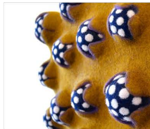
Atsuko Sasaki fabrique des accessoires en feutre travaillés sans coutures depuis les années 2000 sous la marque Taneno. La plante, la semence, la croissance sont ses sujets.