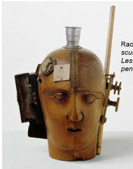
Raoul HAUSMANN , L'esprit de notre temps , sculpture assemblage dans l'esprit Dada, 1920. Les objets à l'extérieur du crâne déterminent les pensées de l'homme.