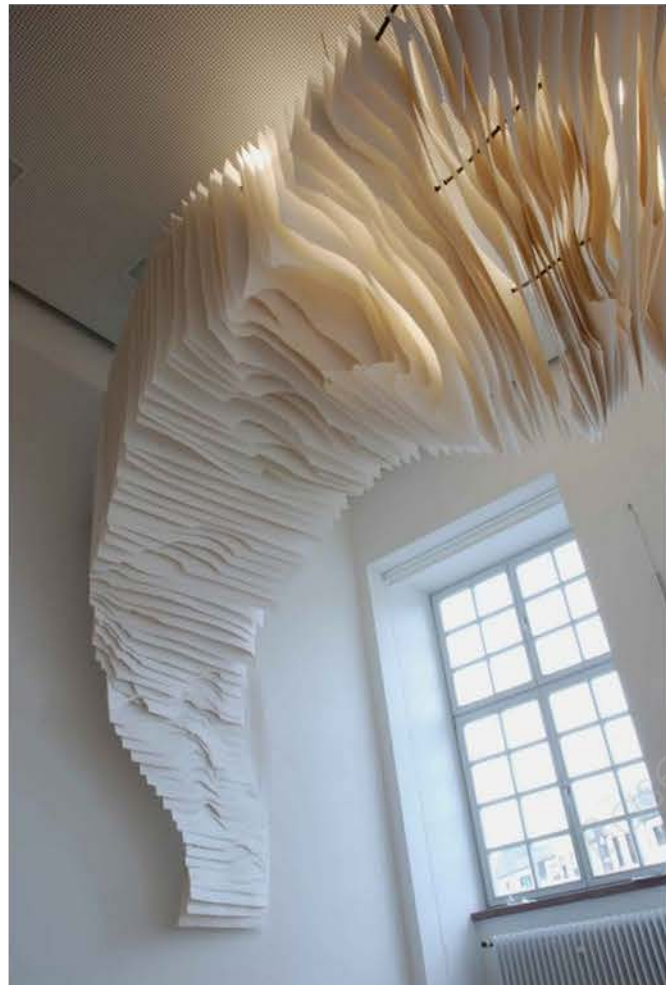
Angela GLAJCAR , installation in-situ, 2008, Feuilles de papier découpé, déchiré pour former des excavations inspirées des glaciers, de la roche, de vortex imaginaires ...