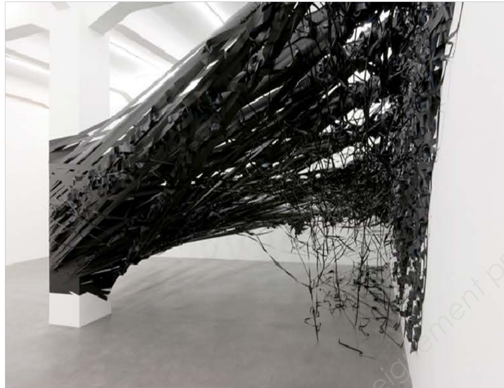
Monika GRZYMALA , Aerial , installation, 5 km de scotch semblant exploser du mur.