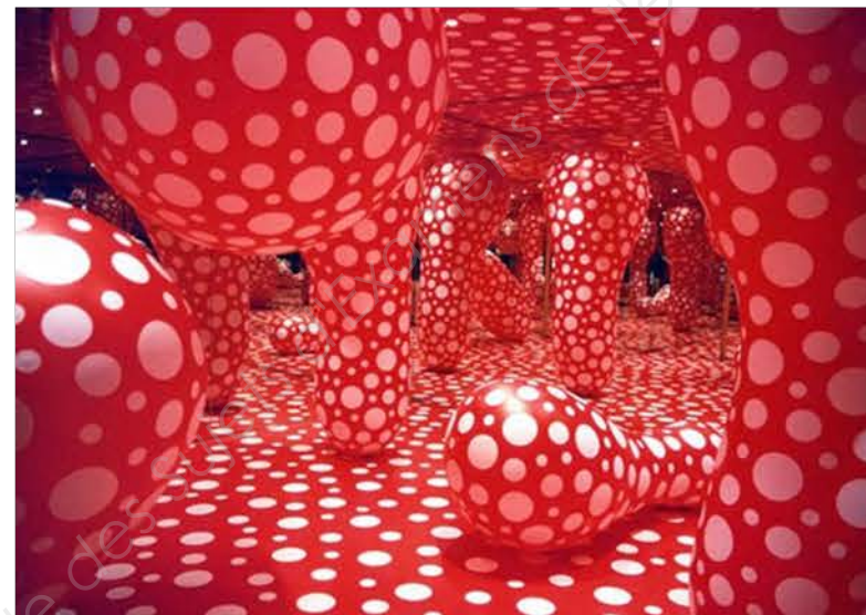
KUSAMA Yayoi , Dots Obsession , 2004. Œuvre née des obsessions enfantines de l'artiste pour les pois et de leur prolifération menaçante avec une notion de répétition et de multiplication de formes et de motifs.