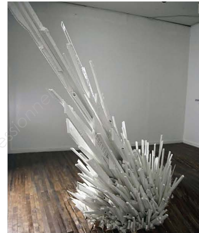
Jonathan LATIANO , Points of Contention , installation. Formes convergentes de croissances cristallines.