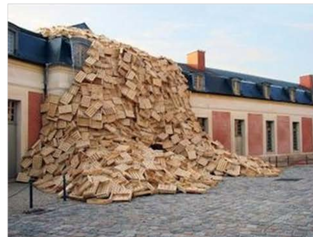
Tadashi KAWAMATA , Gandamaison , 2008. Maréchalerie de Versailles. 5 000 cagettes (bois) construisent une architecture et un parcours éphémères in situ.