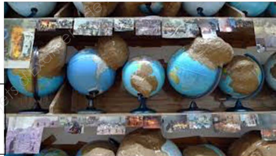
Thomas HIRSCHORN , Outgrowth , détail d'une installation, 2005. Mappemondes contaminées par des excroissances. Ces protubérances réalisées en scotch marron représentent les situations dramatiques de l'actualité..