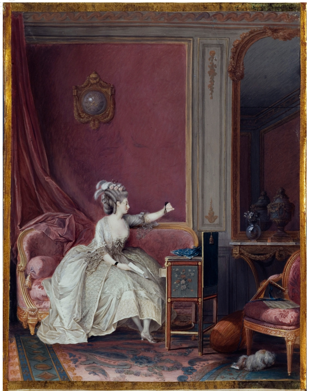
Nicolas La FRENSEN, dit Nicolas Lavreince (1737-1807) la consolation de l'absence