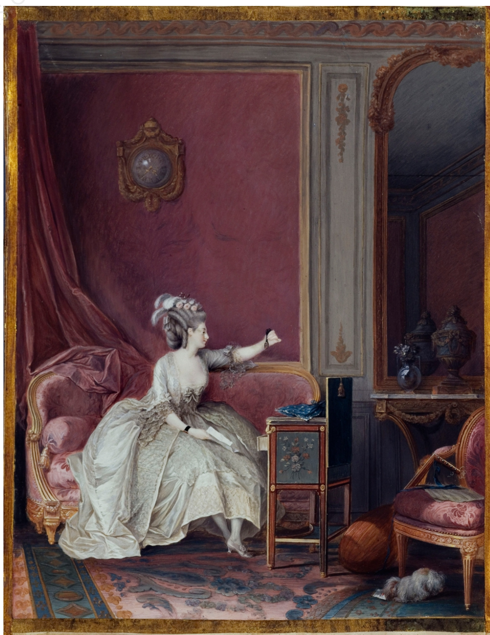
Nicolas La FRENSEN, dit Nicolas Lavreince (1737-1807) la consolation de l'absence