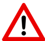
TABLEAU RÉSERVÉ AUX CORRECTEURS

N.B : lorsque plusieurs questions valident la même compétence, il conviendra de l'évaluer globalement et non de réaliser une « moyenne ».