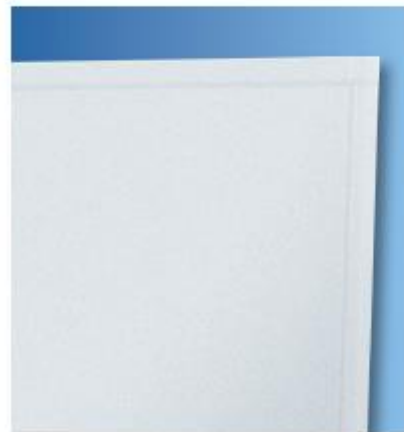
DALLE DE PLAFOND DANOLINE BORD CORRIDOR RÉGULA Décor Regula

La gamme Danoline permet la réalisation de plafonds acoustiques et décoratifs, composés de dalles en plâtre lisses ou perforées et contre-facées d'un voile en fibre végétale absorbante. De quoi garantir une excellente absorption acoustique et une très bonne protection contre la poussière. Les modules standard sont de dimensions modulaires, d'une épaisseur de 9,5 mm ou 12,5 mm selon usinage de bords choisi. Mais de nombreuses autres dimensions sont possibles pour une créativité architecturale sans limite. Consultez-nous !