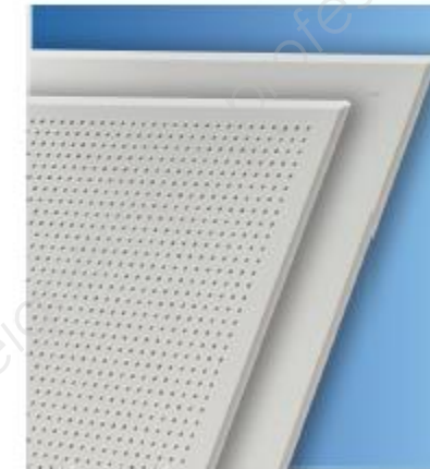
KNAUF CONTRAPANEL GLOBE Gamme Danoline

Contrapanel, c'est avant tout une combinaison gagnante : une plaque de plâtre surdensifiée perforée avec une contre-face renforcée, un voile acoustique Danotex® et un revêtement en papier mélaminé lavable. Autant d'atouts qui confèrent à Contrapanel robustesse et confort acoustique. Contrapanel est une dalle montée sur un double réseau d'ossatures (réseau primaire et secondaire) en vissage apparent (vis à tête blanche). Les panneaux Contrapanel présentent une haute qualité mécanique.