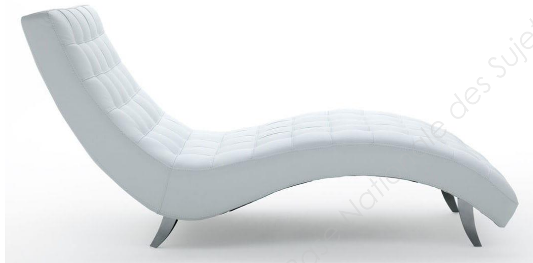
Archiexpo méridienne contemporaine « Ginger »

Sanglage élastique Garniture mousse Hauteur des côtés du fût : 10 cm Couverture passepoilée haut et bas Matelassage du plateau selon le dessin technique Jaconas et dos extérieur assemblés machine