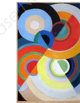
Sonia Delaunay, « Rythme couleur », peinture, 1939