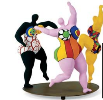
Niki de Saint-Phalle, « Les baigneuses », polyester 1974