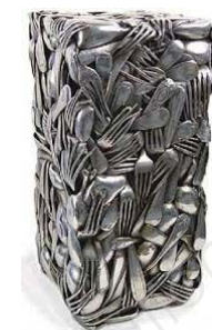
César, « Compression de couverts », métal, 1982