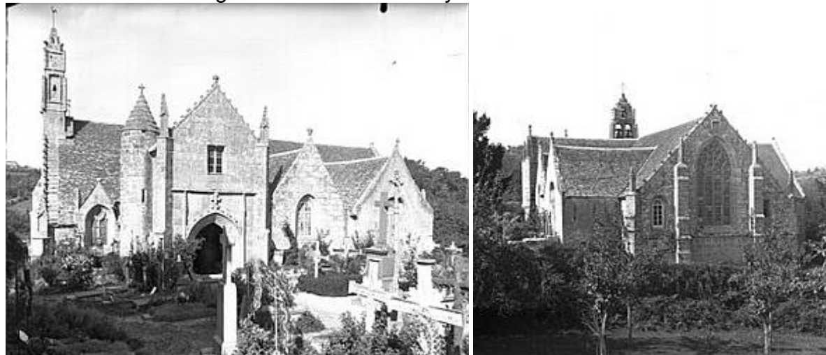
Clichés du début du XX ème siècle. À droite, vue de la façade Sud, à gauche, vue de l'église et du chevet plat depuis l'est.

La paroisse avait une emprise territoriale très importante jusqu'en 1826, date à laquelle une partie de cette emprise fut rattachée à l'église Saint-Jean du Baly de Lannion.