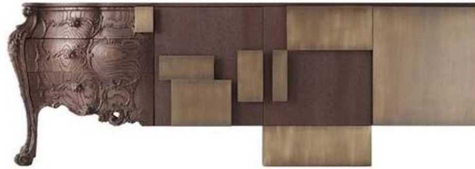
Bahut évolution , Ferruccio LAVIANI, 2009.