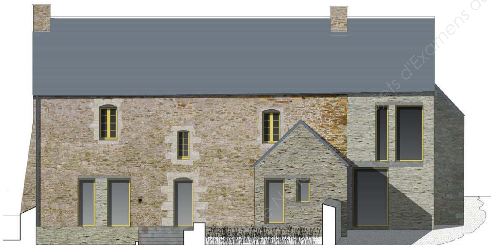
Projet d'extension et d'aménagement du jardin

L'orientation engagée pour le réaménagement des abords s'inscrit, quant à elle, de manière plus large dans une réflexion d'ensemble que souhaite la ville, comptant sur la requalification de l'aire de stationnement située en face de l'édifice mais qui fera l'objet d'une demande et d'une étude propre. »