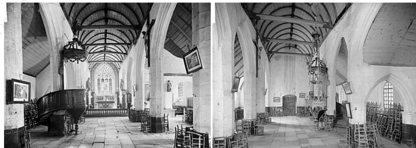
Clichés du début du XX ème siècle, source base de données Mémoire, Ministère de la Culture et de la Communication. Vue d'ensemble de la nef vers le chœur et vers la façade occidentale. Il est intéressant de noter le badigeon blanc qui recouvre la totalité des parements, la présence de la chaire à prêcher et celles des cordes qui servaient à actionner les cloches encore manuelles.

Les chapelles latérales Nord et Sud formant transept ont été construites plus tardivement, au XVII ème siècle. Celle située au Sud s'étend sur deux travées. La travée Ouest reçoit les fonts baptismaux (et un très beau relief en bois sculpté du XVII ème siècle représentant l'Adoration des Mages) tandis que dans la seconde travée se trouve un retable datant du milieu du XVII ème siècle appuyé sur son mur Est. Cette travée donne accès à la sacristie située entre le retable et le chevet plat (angle Sud-est de l'église) dans un édicule manifestement plus récent. La chapelle Nord comporte une niche qui abrite une Vierge à l'Enfant.