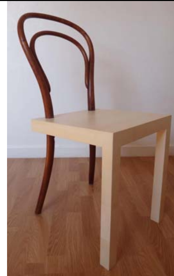
Hommage à la chaise Thonet , Célia PERSOUYRE, 2013.