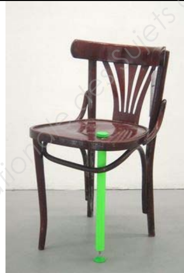
Reanim , 5.5 designers, 2004.