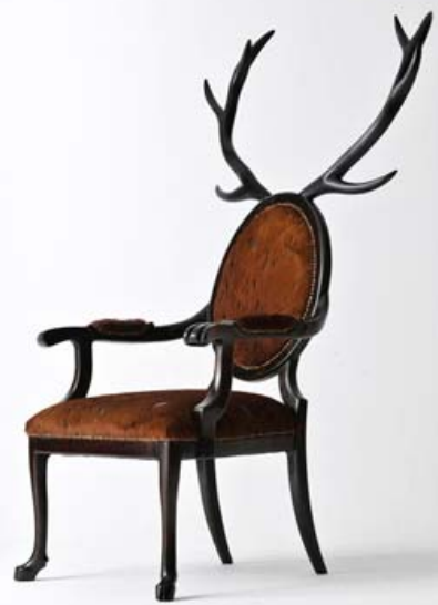
Fauteuil HYBRID de Merve KAHRAMAN, 2012.