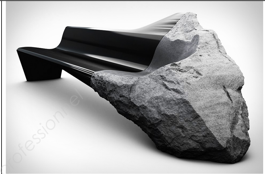
Sofa onyx , Pierre GIMBERGUES, 2014.