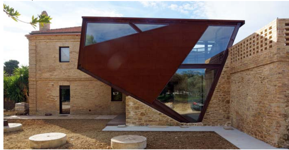
Extension architecturale, Rocco VALENTINI, 2016.