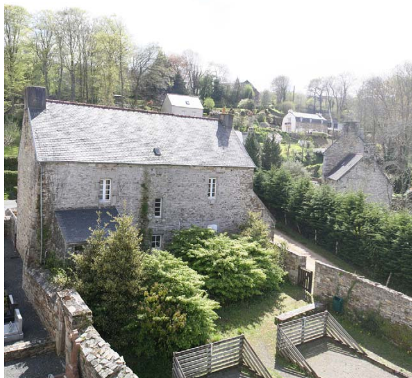
Le presbytère et son jardin (état actuel)