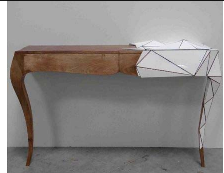
Console Marilyn à facettes , Claire PARIS, 2014.