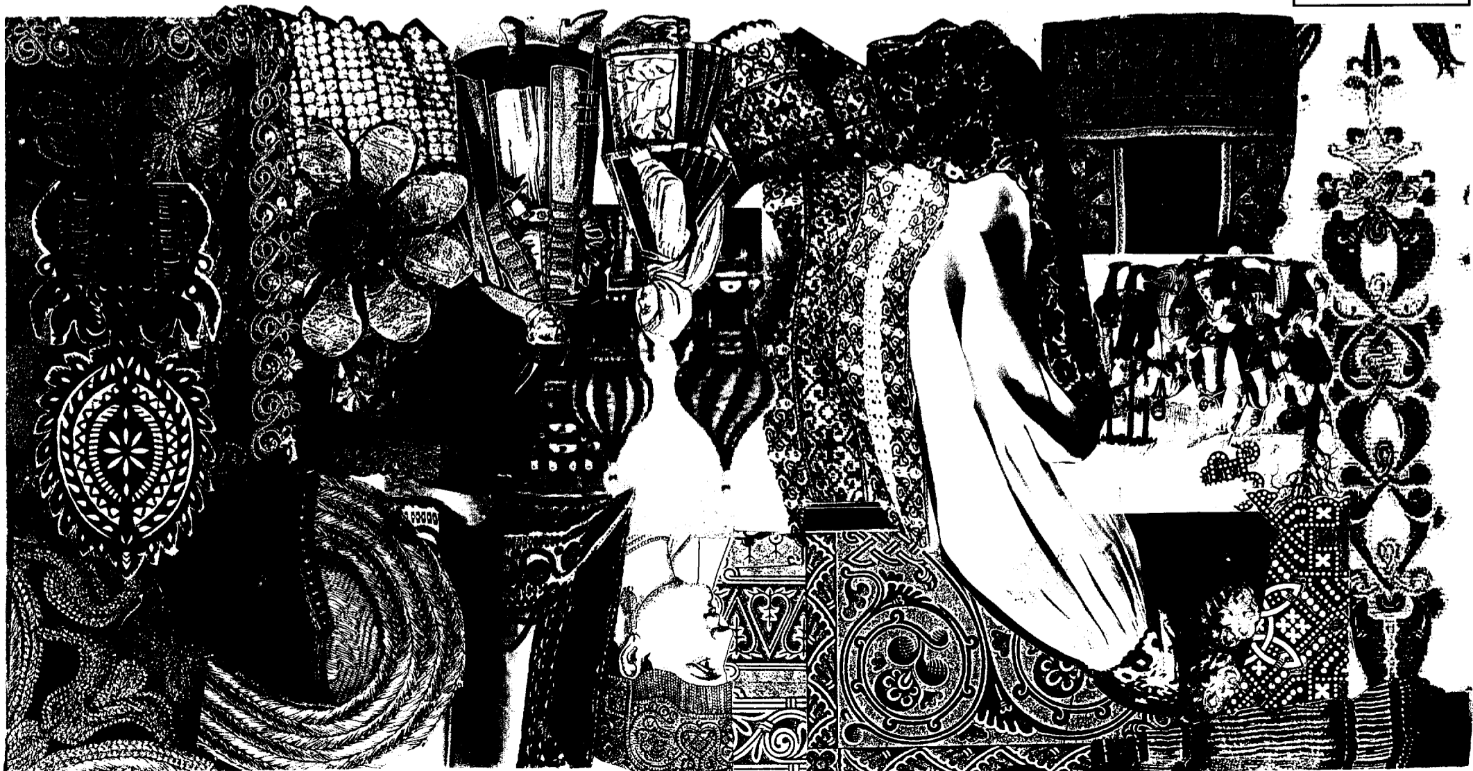
EUROPE DE L'EST