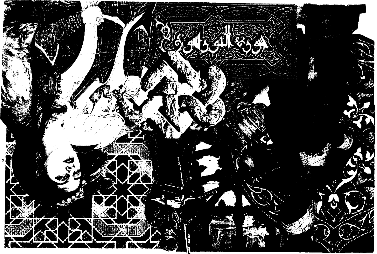
AFRIQUE DU NORD