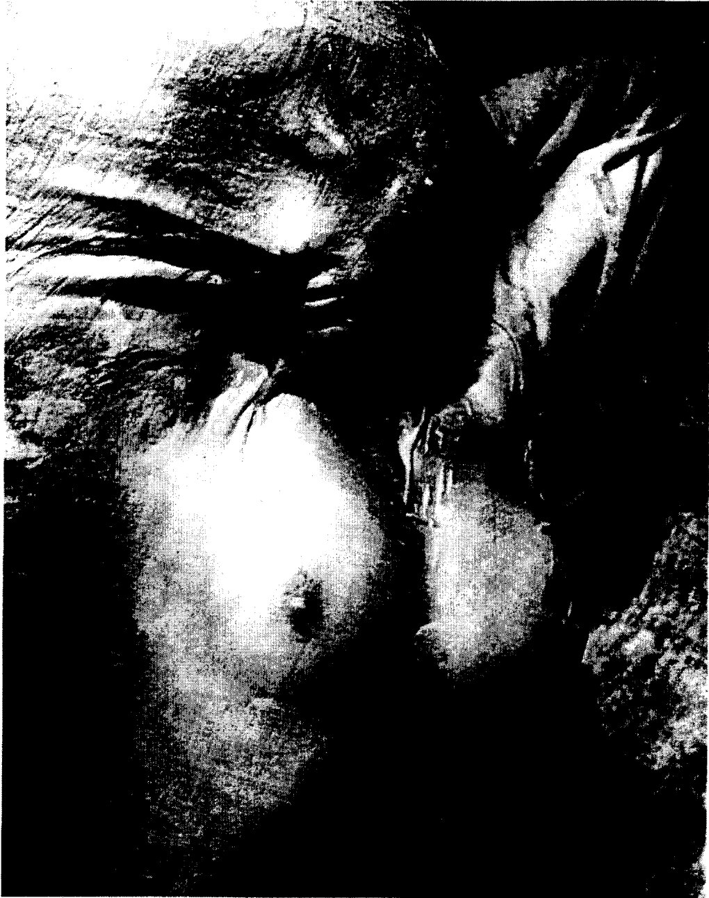
doc 2 Blumenfeld : « le voile mouillé » 1937