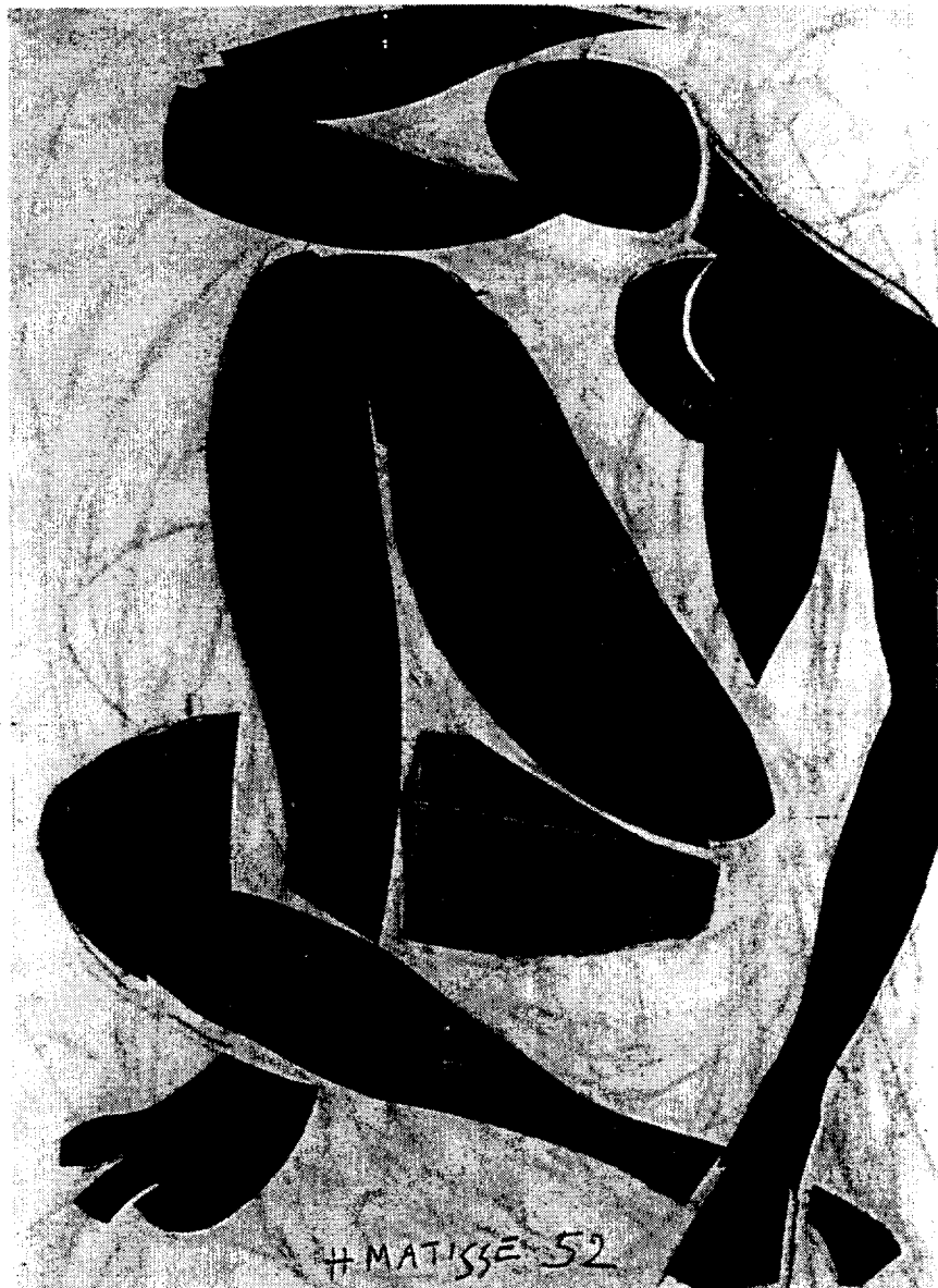
doc 3 Henri Matisse : « nu bleu IV » 1952