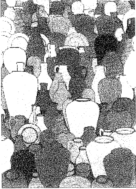
Caufield : Pottery